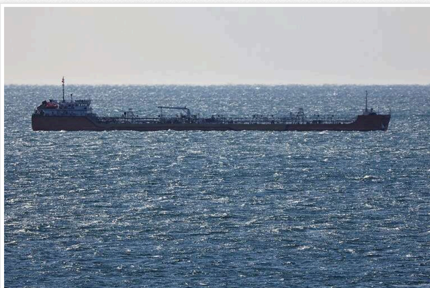
Китай та Індія призупинили закупівлю російської нафти через зростання витрат на доставку

Reuters повідомляє, що Китай та Індія тимчасово зупинили імпорт російської нафти марки ESPO через різке збільшення витрат на транспортування, спричинене новими санкціями США.