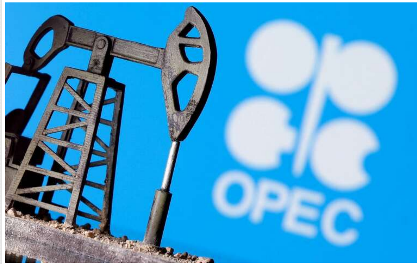
ОПЕК+ не реагує на заклики Трампа знизити ціни на нафту

Саудівська Аравія та інші країни-члени ОПЕК+ поки не планують змінювати свою стратегію щодо видобутку нафти, попри заклик Дональда Трампа влищити на зниження цін.