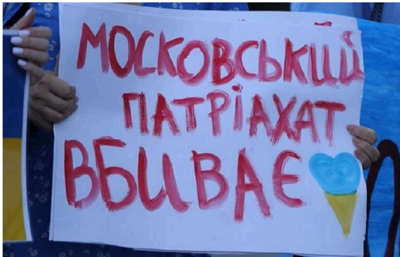
Майже 75% українців схвалюють заборону діяльності РПЦ в Україні

Майже три чверті громадян України підтримують положення Закону "Про захист конституційного ладу у сфері діяльності релігійних організацій".