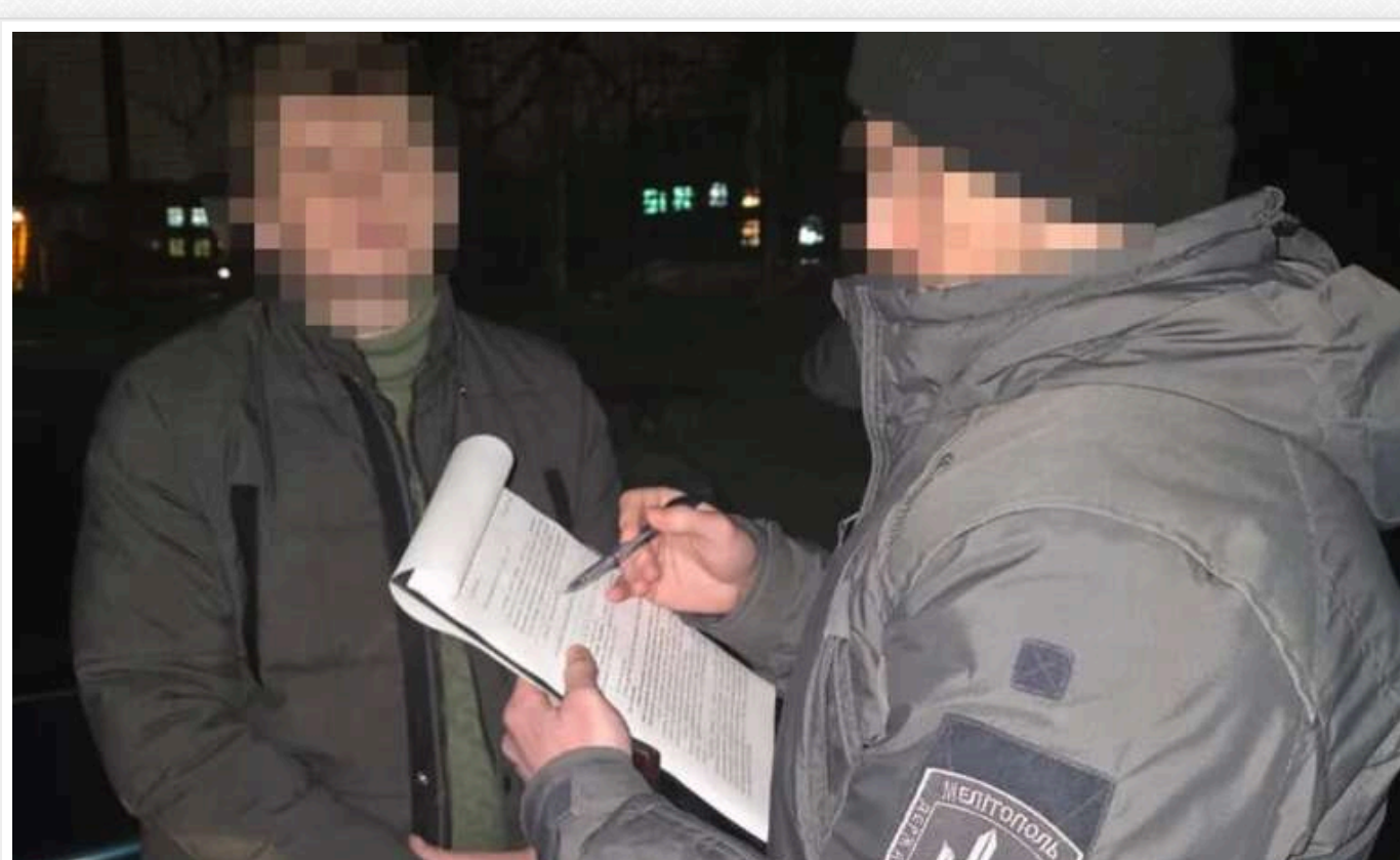
У Запоріжжі затримали пару, яка організувала "сімейний бізнес" на дезертирах

Співробітники Державного бюро розслідувань спільно з СБУ викрили та затримали подружню пару в Запоріжжі, яка заробляла на організації втеч військових із частин. До "сімейного бізнесу" входили адвокат і його дружина – працівниця правоохоронного органу.