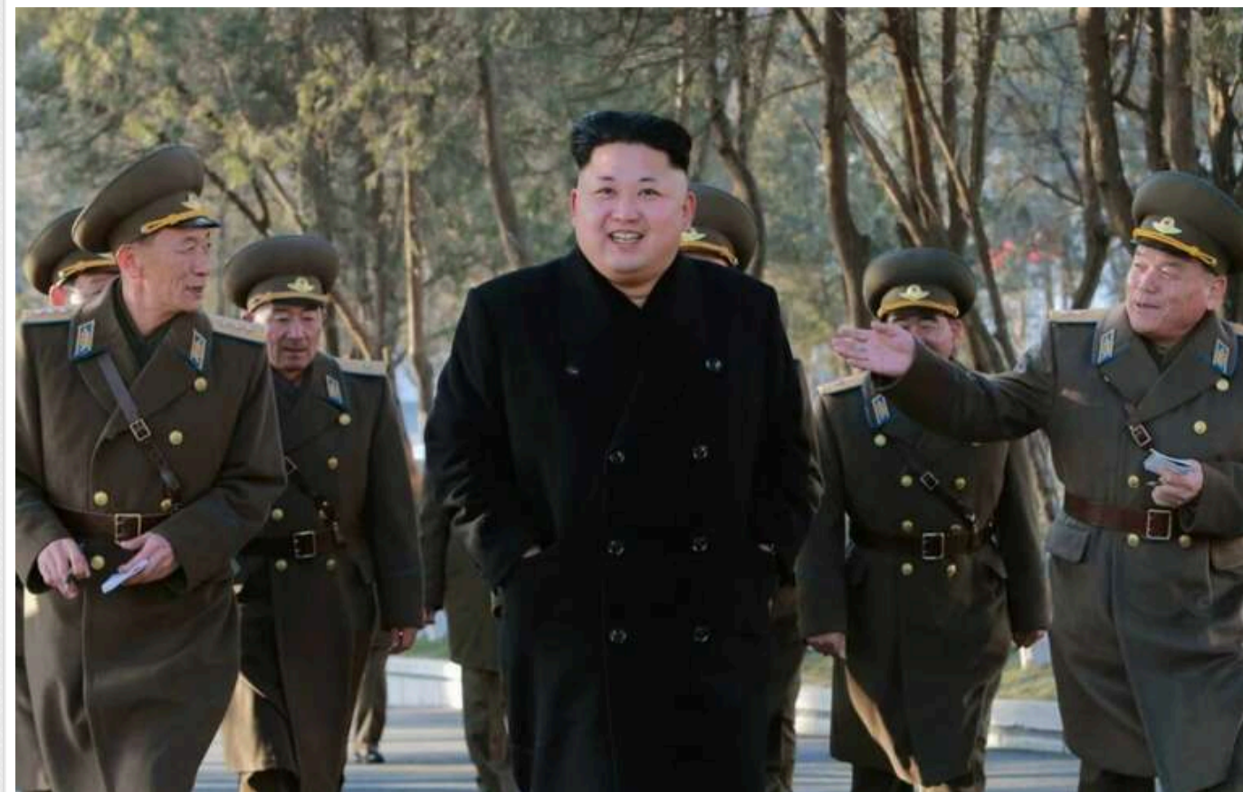
Над режимом Кім Чен Ина нависла загроза, - WSJ

Кім Чен Ін має абсолютну владу у Північній Кореї та вважається богоподібним у своєму народі. Однак над диктатором нависла загроза: неояльність молоді його країни, пише The Wall Street Journal.