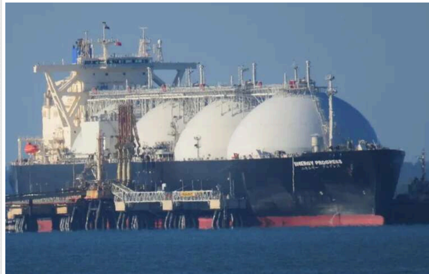
FT: Країна ЄС попри заборону збільшує закупівлю газу з РФ

Німеччина збільшує закупівлі російського СПГ (зрідженого природного газу) через порти інших країн ЄС, попри офіційну відмову від прямих поставок. Відсутність прозорості на енергетичному ринку ЄС дозволяє "відбілювати" російський газ, що ускладнює боротьбу із залежністю від російського палива.