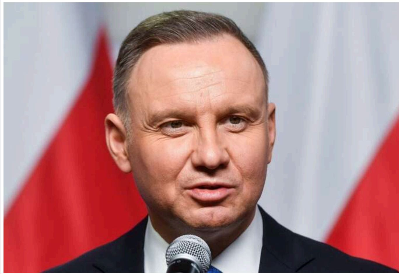
Дуда закликав до демонтажу "Північних потоків"

Російські газопроводи "Північний потік" слід демонтувати, бо поновлення газових потоків з РФ до Західної Європи неможливе навіть після підписання миру між Україною та Росією.