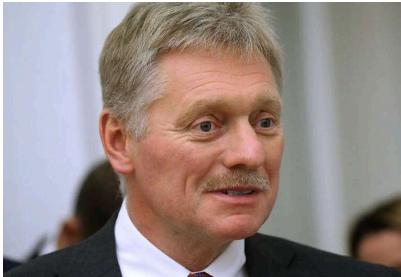
У Кремлі відреагували на припущення Такера Карлсона щодо ймовірних спроб адміністрації Байдена вбити Путіна

Прессекретар російського диктатора Дмитро Песков заявив, що спецслужби РФ вживають усіх заходів для захисту Володимира Путіна.