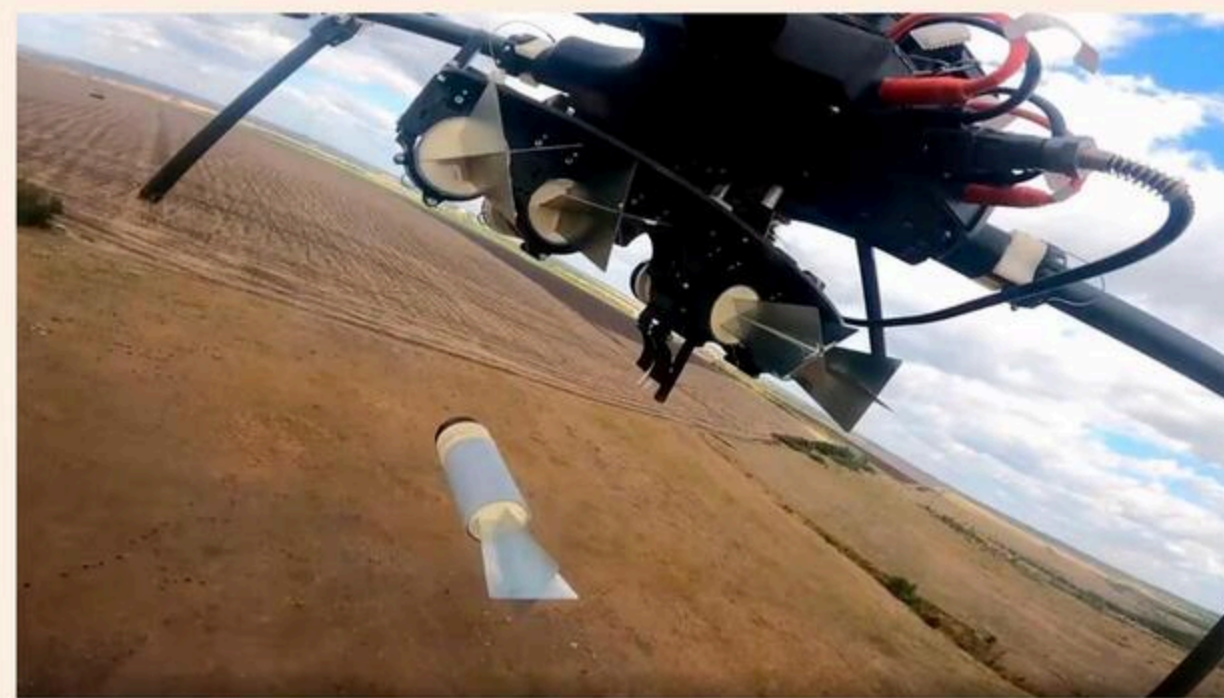
A Russian drone drops an explosive at an undisclosed location in Donetsk region. An EU ban would target traders, including second-hand sellers, in the bloc who send consoles to Russia

Country's armed forces use gaming kit to control attack drones against Ukrainian targets, Brussels says