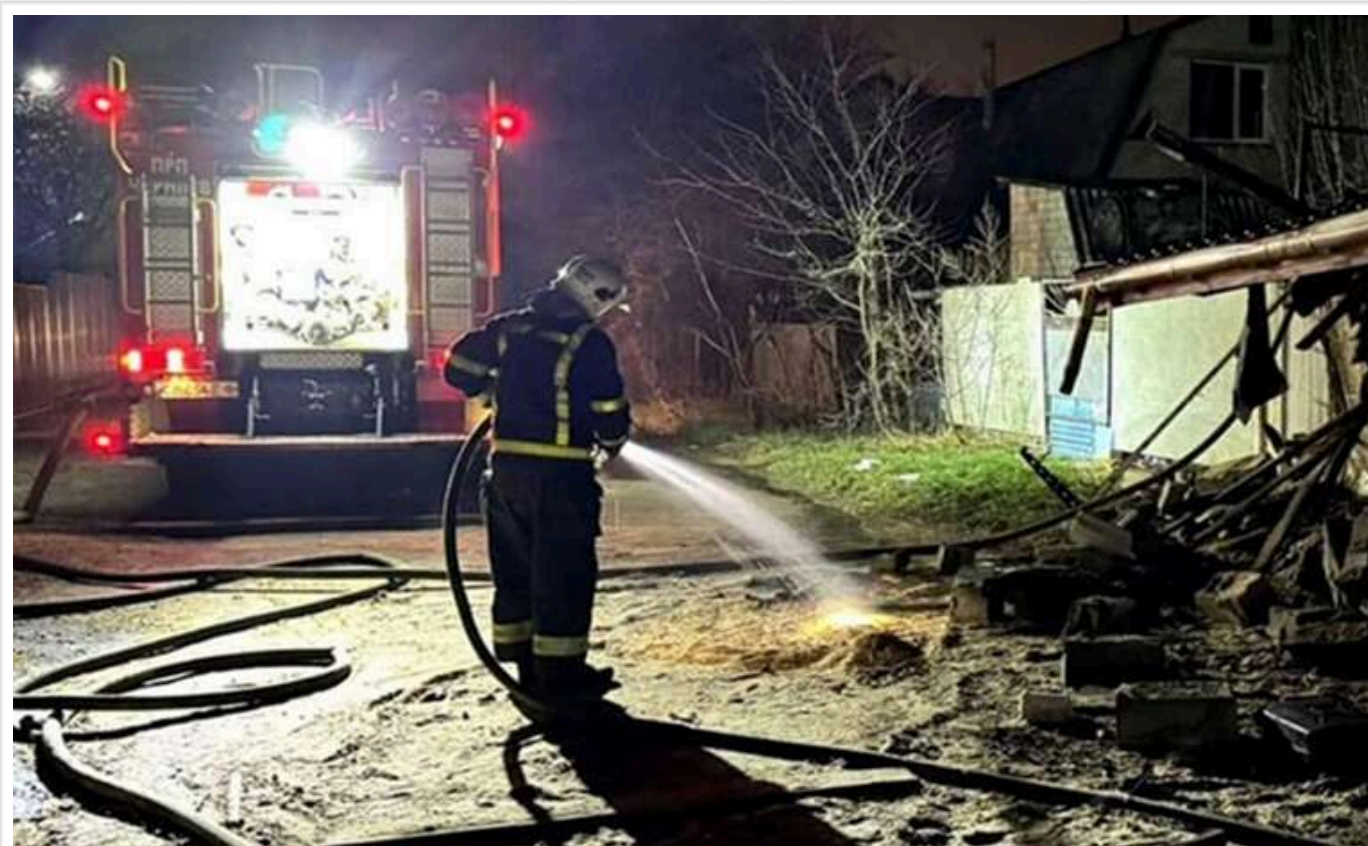
Наслідки атаки на Чернігів: травмовані двоє людей, згоріла господарча будівля

У ніч з 27 на 28 січня в Чернігові відбулася пожежа в дерев'яній господарській будівлі. Внаслідок пожежі постраждали люди 1971 та 1969 років народження.