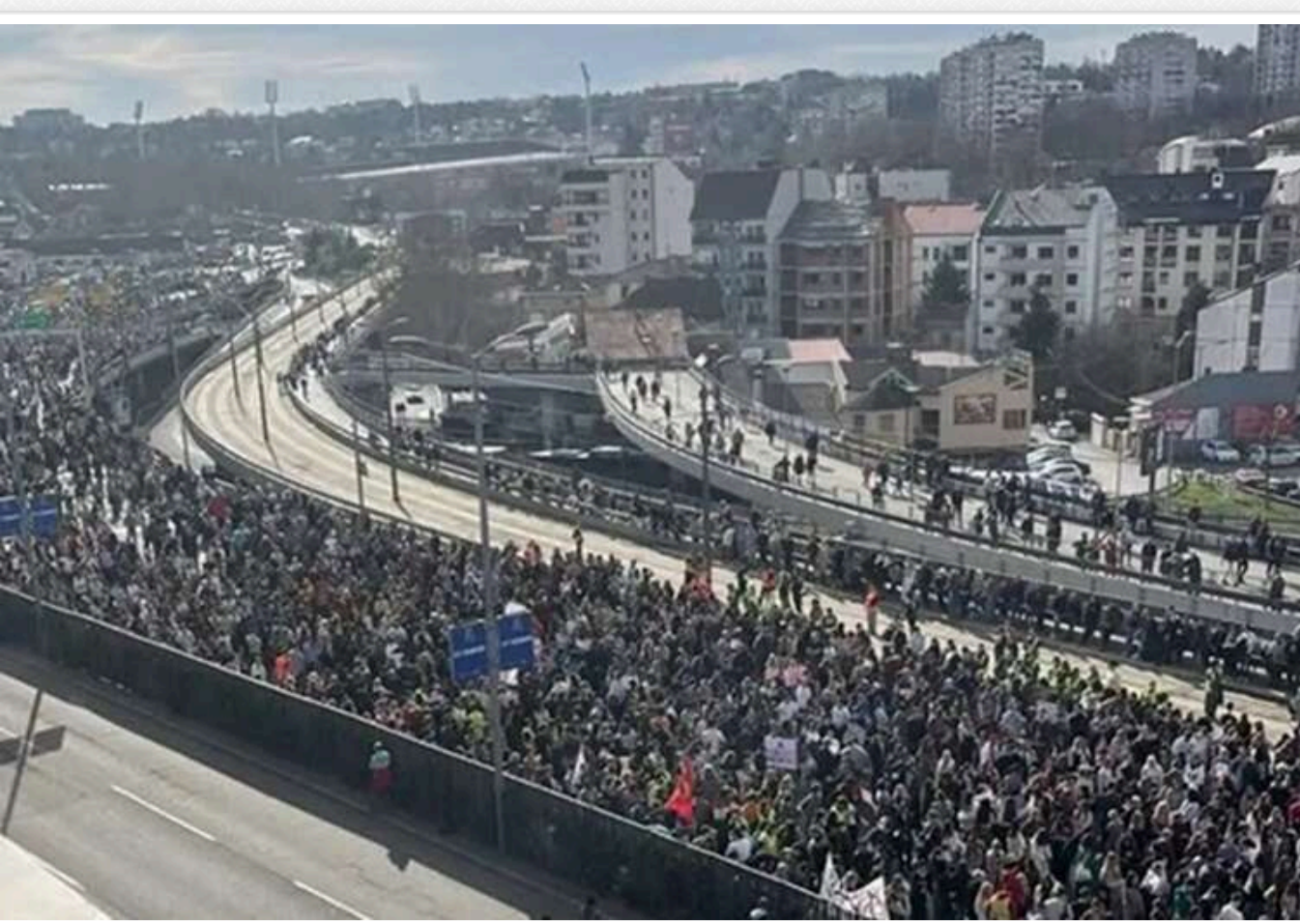
У Сербії більша частина уряду, включаючи прем'єра, йде у відставку через масштабні протести

Більшість членів уряду Сербії, включаючи прем'єр-міністра Мілоша Вучевича, подають у відставку на тлі масових протестів в країні. Водночас президент Олександр Вучич заявив, що протести створюють проблему для економіки країни.