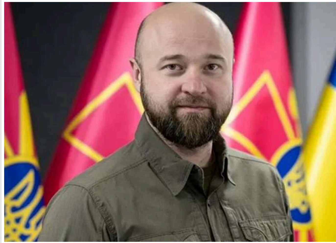
Кабмін звільнив заступника Умерова