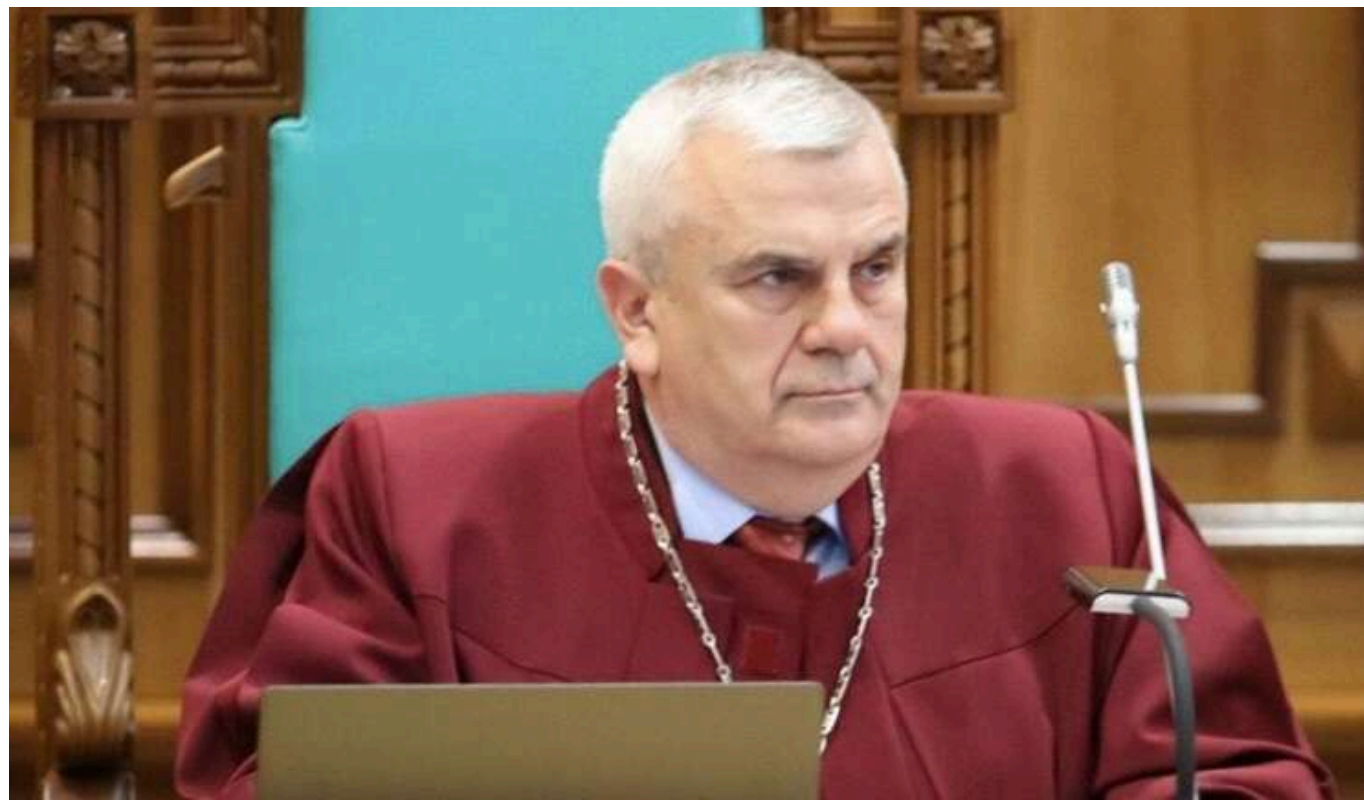
Суддю Петришина призначили в.о. голови Конституційного Суду через кризу з кворумом

Олександр Петришин (на фото), найстарший суддя Конституційного Суду України (КСУ), тимчасово виконує обов'язки голови цього органу. Його призначення відбулося на тлі чергової невдалої спроби обрати постійного керівника, оскільки через відставку трьох суддів у КСУ не вистаєє кворуму для ухвалення ключових рішень.