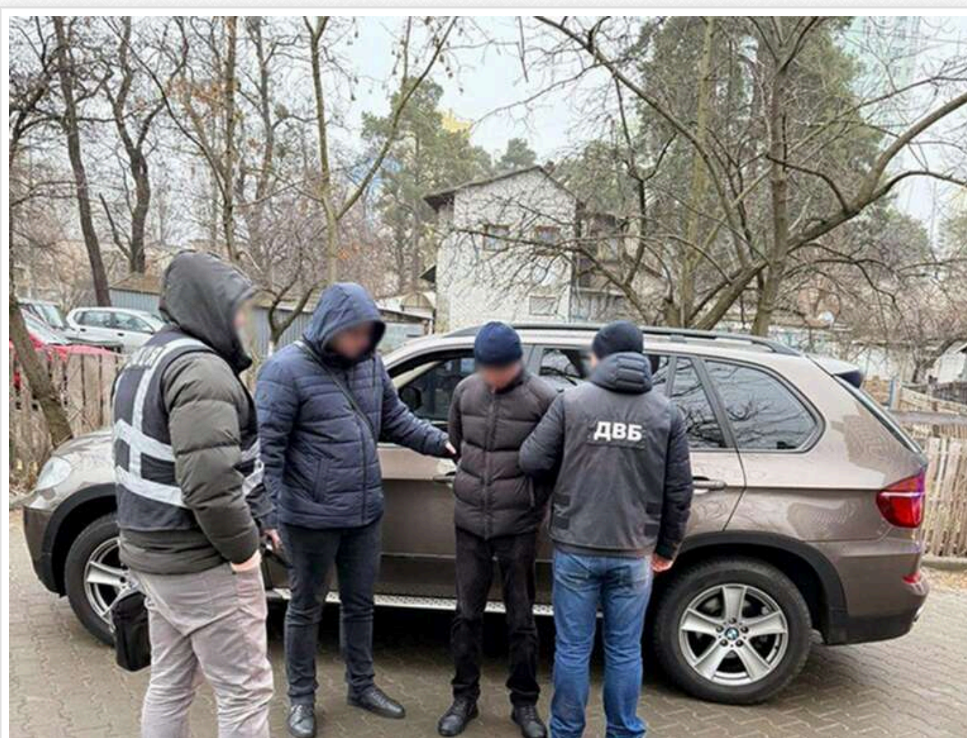
У столичних сервісних центрах МВС викрили схеми продажу "гарантованих" водійських прав

У столиці викрили дві злочинні схеми, пов'язані з "торгівлею впливом" у сервісних центрах МВС. Інструктори з водіння за гроші пропонували допомогу в складанні іспитів та фіктивне навчання в автошколах. Правоохоронці збрали доказову базу та затримали злочинців під час отримання коштів. Усім фігурантам висунуто підозри.