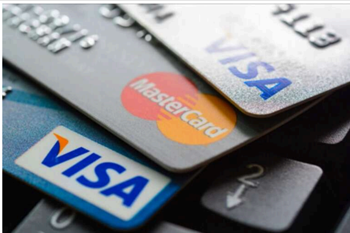
Нові ліміти на грошові перекази: обмеження не будуть стосуватися клієнтів із підтвердженими доходами та волонтерів

Починаючи з 1 лютого 2025 року в Україні банки почнуть встановлювати обмеження на перекази за реквізитами IBAN для клієнтів без документально підтверджених доходів.