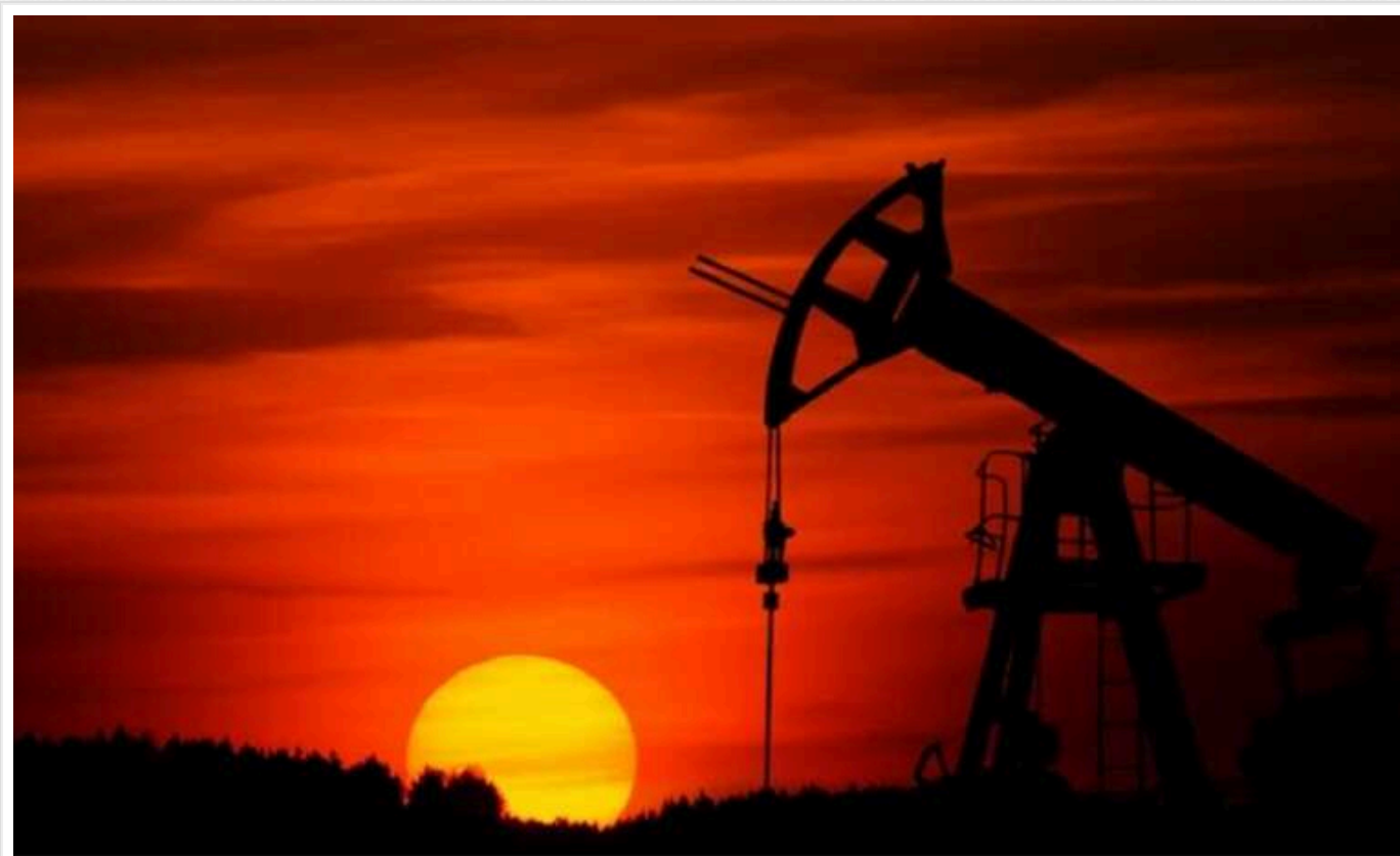
Ціни на нафту Urals і ESPO знижуються на тлі санкцій, а розрив між Brent і Dubai розширюється

Після введення нових американських санкцій 10 січня, дисконти на нафту Urals до еталонної ціни Brent збільшилися на $1,5–2,6 за барель, досягнувши рівня $13,5–14,4 за барель.