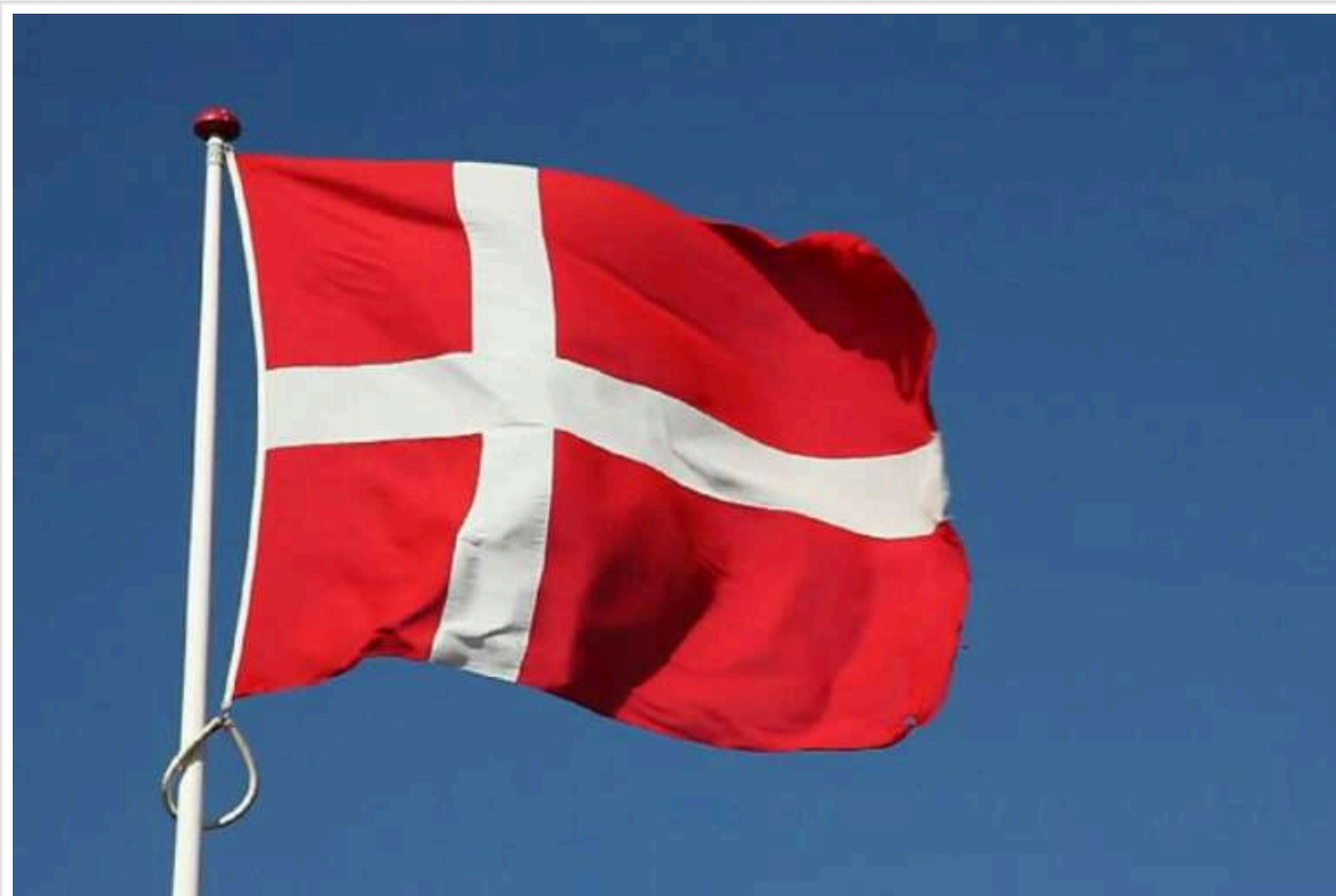
Данія виділить 2,1 мільярда доларів на зміцнення військової присутності в Арктиці на тлі інтересу Трампа до Гренландії

Данія планує виділити 2,1 мільярда доларів на зміцнення своєї військової присутності в Арктиці у зв'язку з інтересом Трампа до контролю над Гренландією.