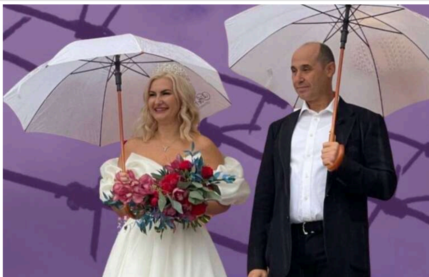
Поліція Кіпру заморозила 24 мільйони євро у криптовалюті, пов'язаних із братами Гіріними та злочинною мережею з відмивання грошей

У рамках міжнародної операції під кодовою назвою YUZUK, проведеної місцевою поліцією спільно з Європолем, на Кіпрі були конфісковані квартири, розкішні автомобілі, готівкові кошти, а також заморожено 24 млн євро у криптовалюті.