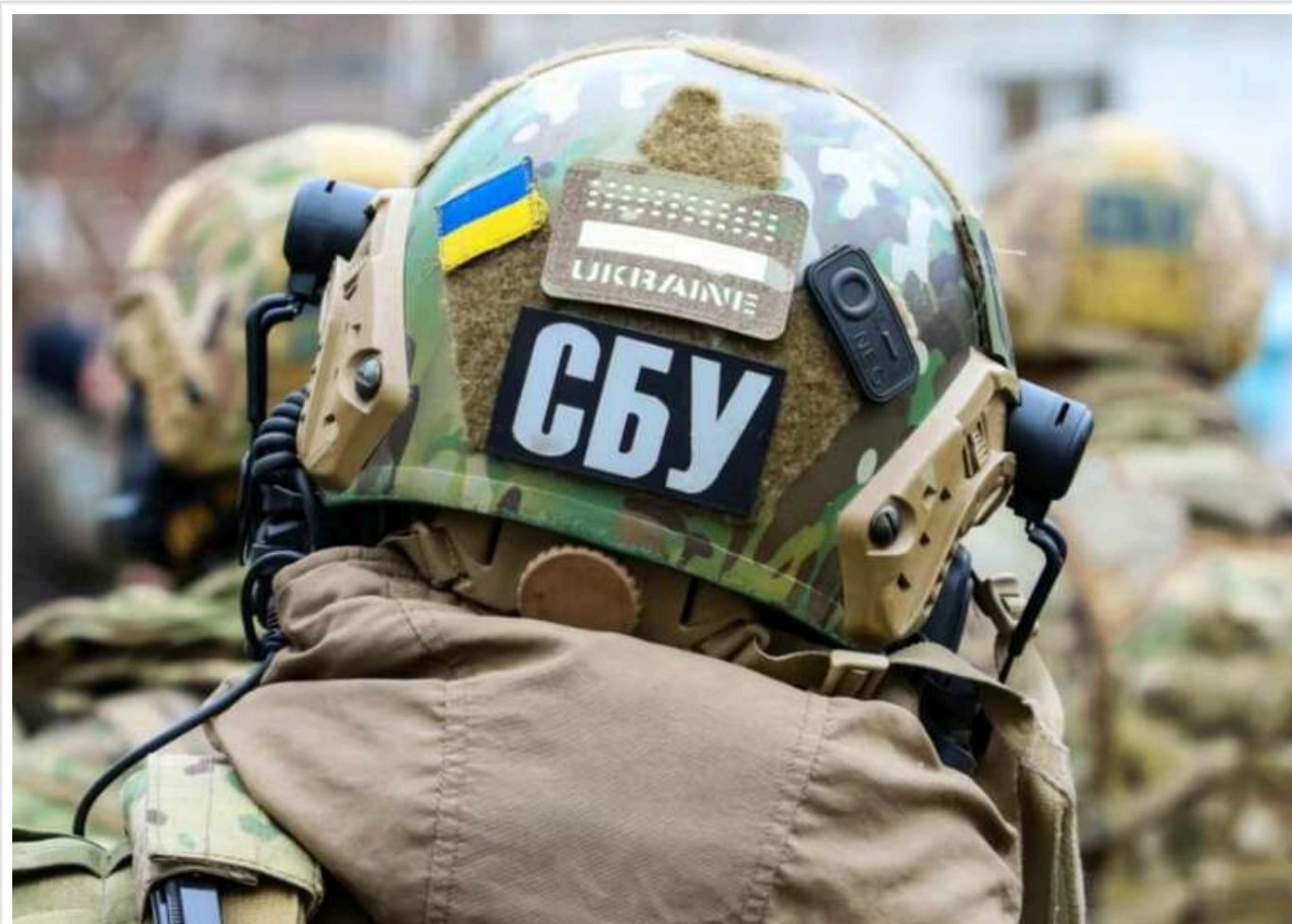
СБУ проведе перевірку викладачів університету КНУ ім. Карпенка-Карого