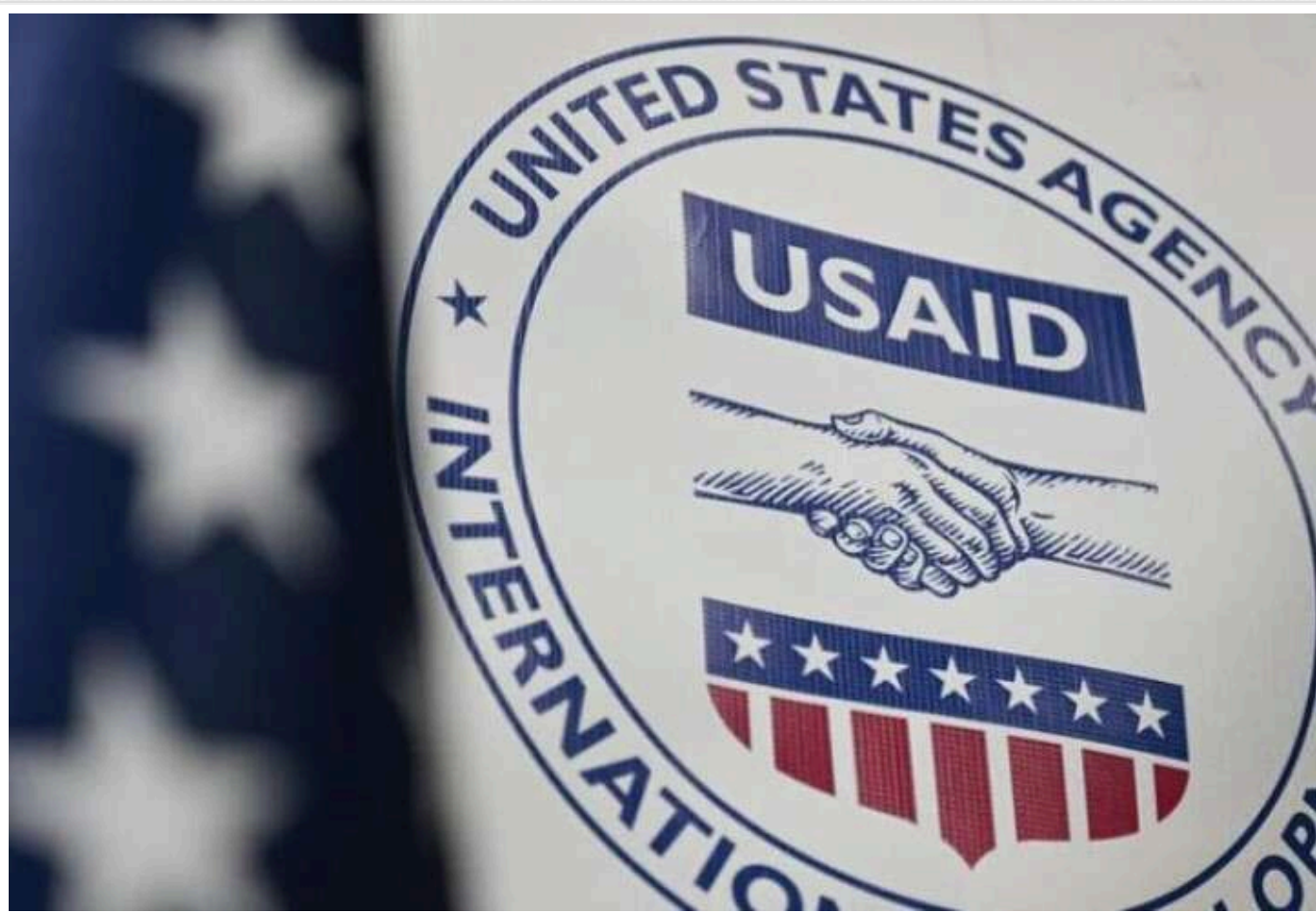
В Україні здійснюється 112 проєктів USAID на загальну суму 7 мільярдів доларів

Про це повідомив нардеп Мар'ян Заблоцький.