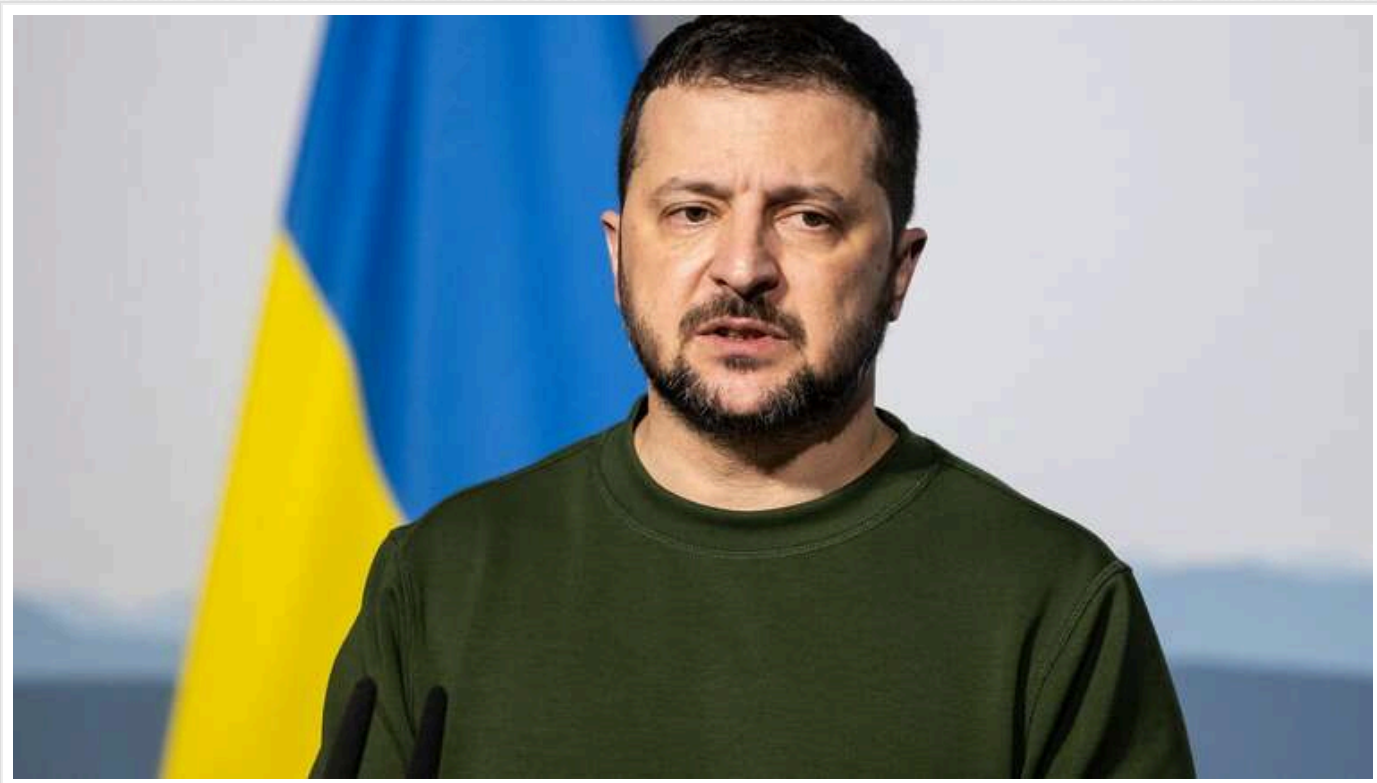
Демобілізація неможлива під час війни, ротації та відпустки для військових передбачені, - Зеленський

В Україні, відповідно до законодавства, мобілізація чоловіків починається з 25 років. Військовослужбовці мають право на ротації та відпустки, але демобілізація наразі неможлива.