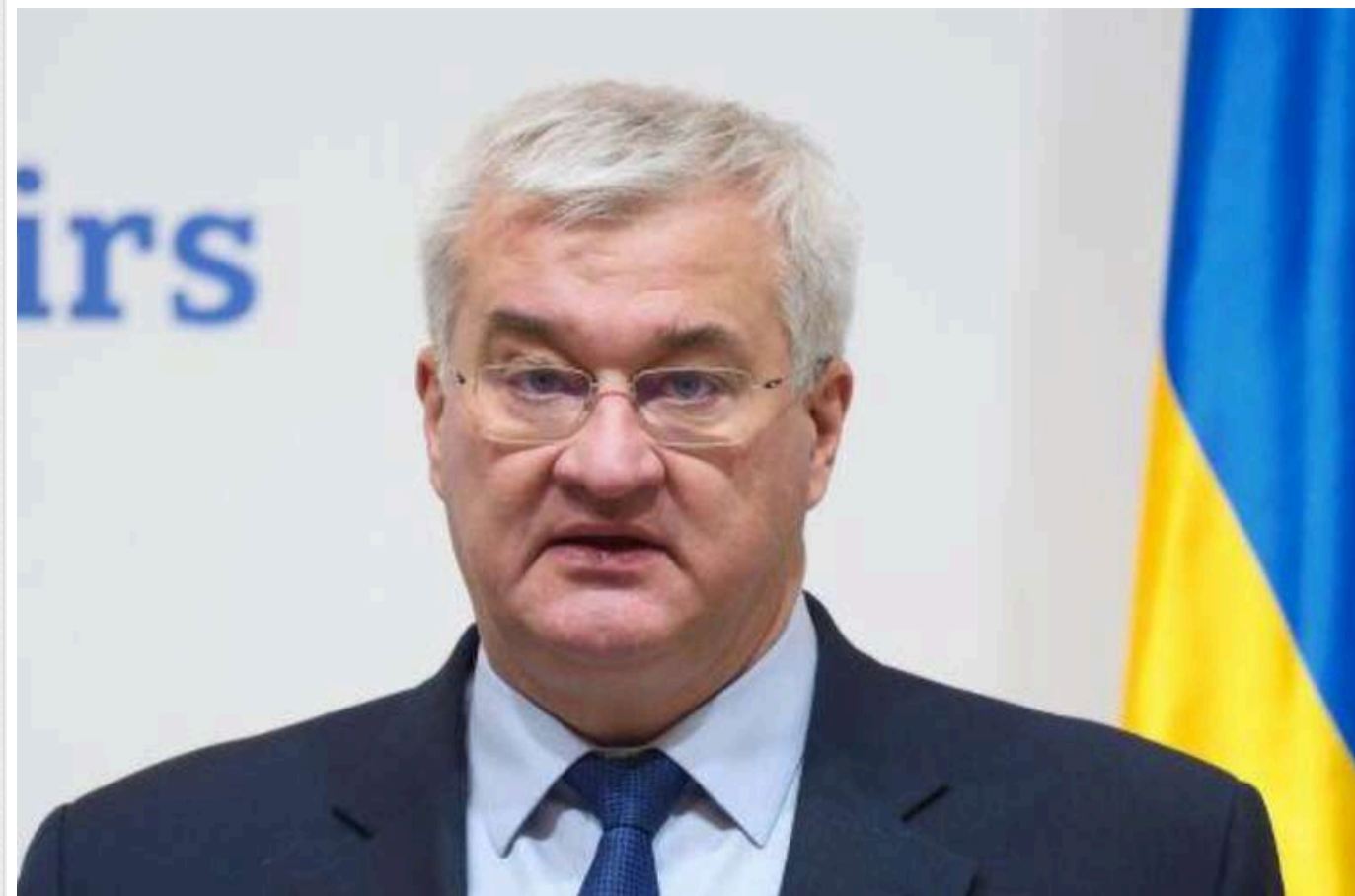
В МЗС України закликали ЄС посилити санкції проти Росії

Міністр закордонних справ України Андрій Сибіга закликав країни ЄС об'єднати зусилля з новою адміністрацією США для посилення санкційного тиску на Росію. Зокрема, продовжити чинні санкції та схвалити нові обмеження.