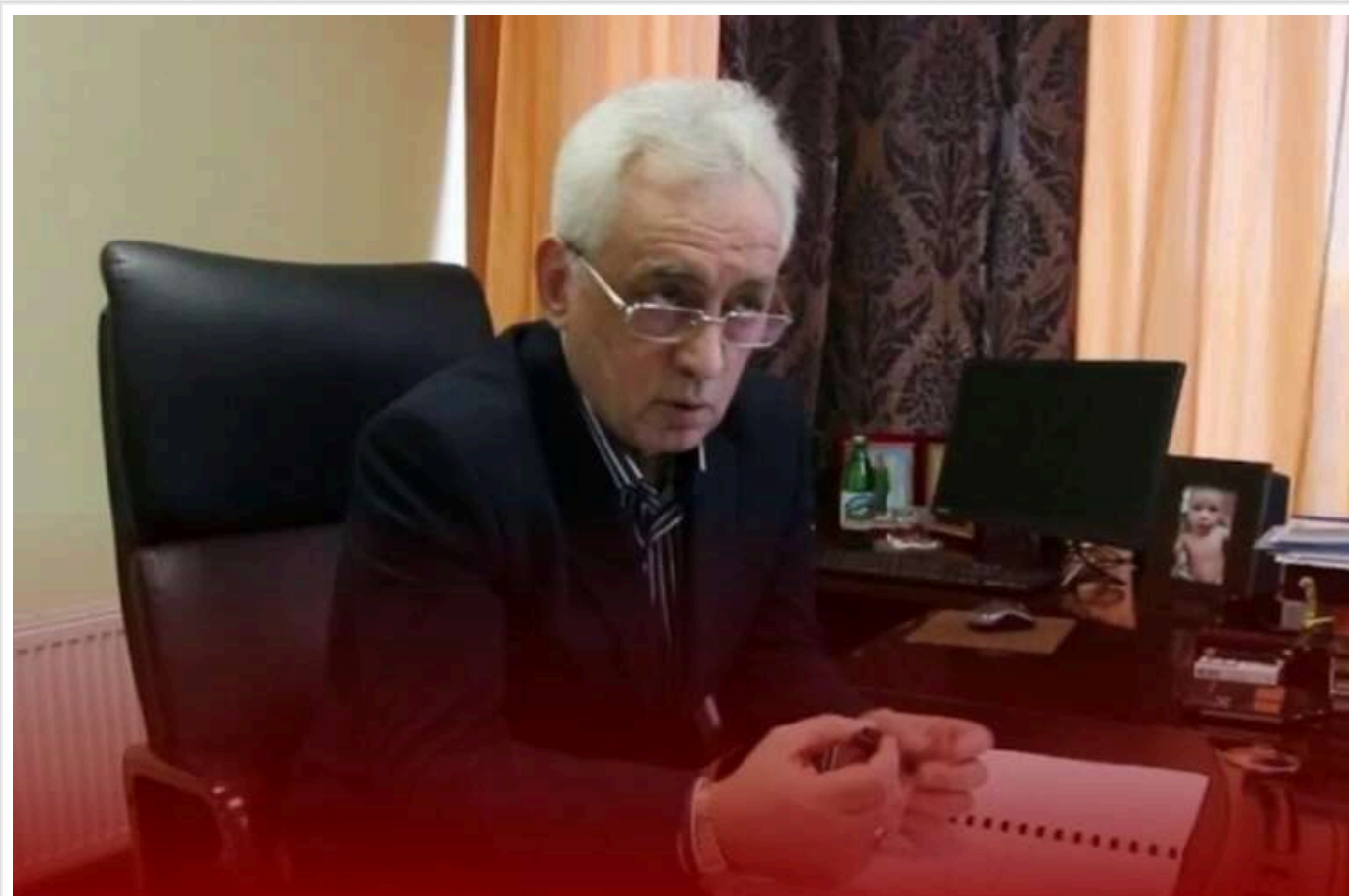
Екскерівник Чернівецької митниці вийшов з-під варту під заставу у 10 мільйонів гривень

Колишній керівник Чернівецької митниці, який, імовірно, був співорганізатором групи осіб, що спричинили майже 290 мільйонів гривень збитків на митниці через ухилення від сплати мита, вийшов з-під варту.