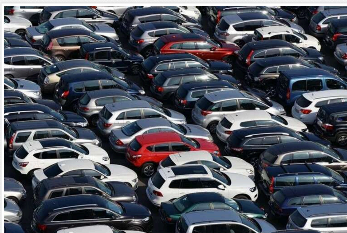
Яке місце зайняв український авторинок у 2024 році

В Європі загальний обсяг продажів автомобілів зріс на 0,9%, але результати року були досить різноманітними.