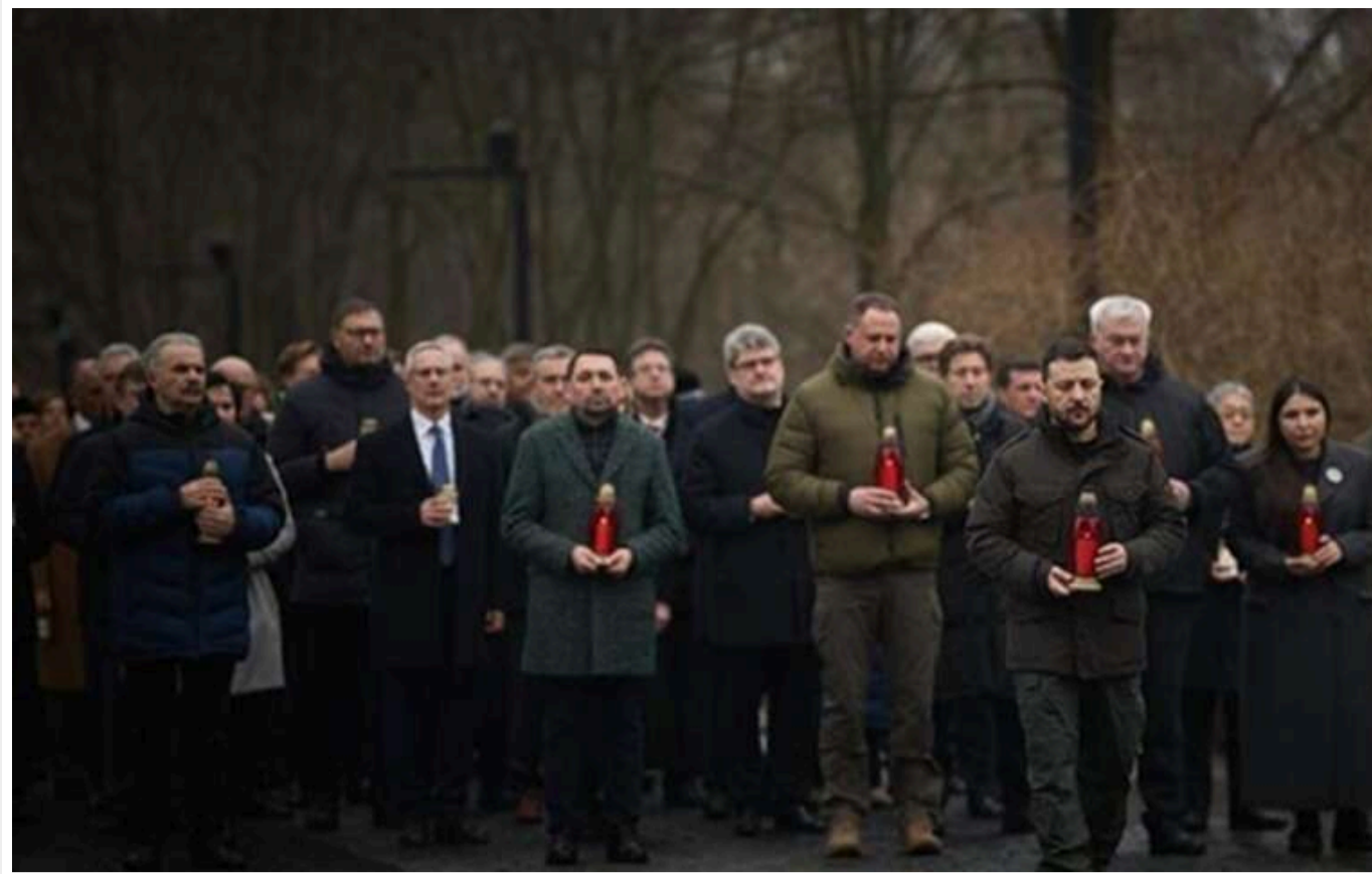
Зеленський вшанував пам'ять жертв Голокосту

27 січня світ відзначає пам'ять жертв Голокосту як трагедію, що спричинила масштабне винищення єврейського народу. 80 років тому, 27 січня 1945-го, відбулося звільнення Аушвіцу — одного з найбільших німецьких нацистських концтаборів, який майже п'ять років функціонував на території Польщі під час Другої світової війни. Відтоді ця дата позначається як Міжнародний день пам'яті жертв Голокосту.