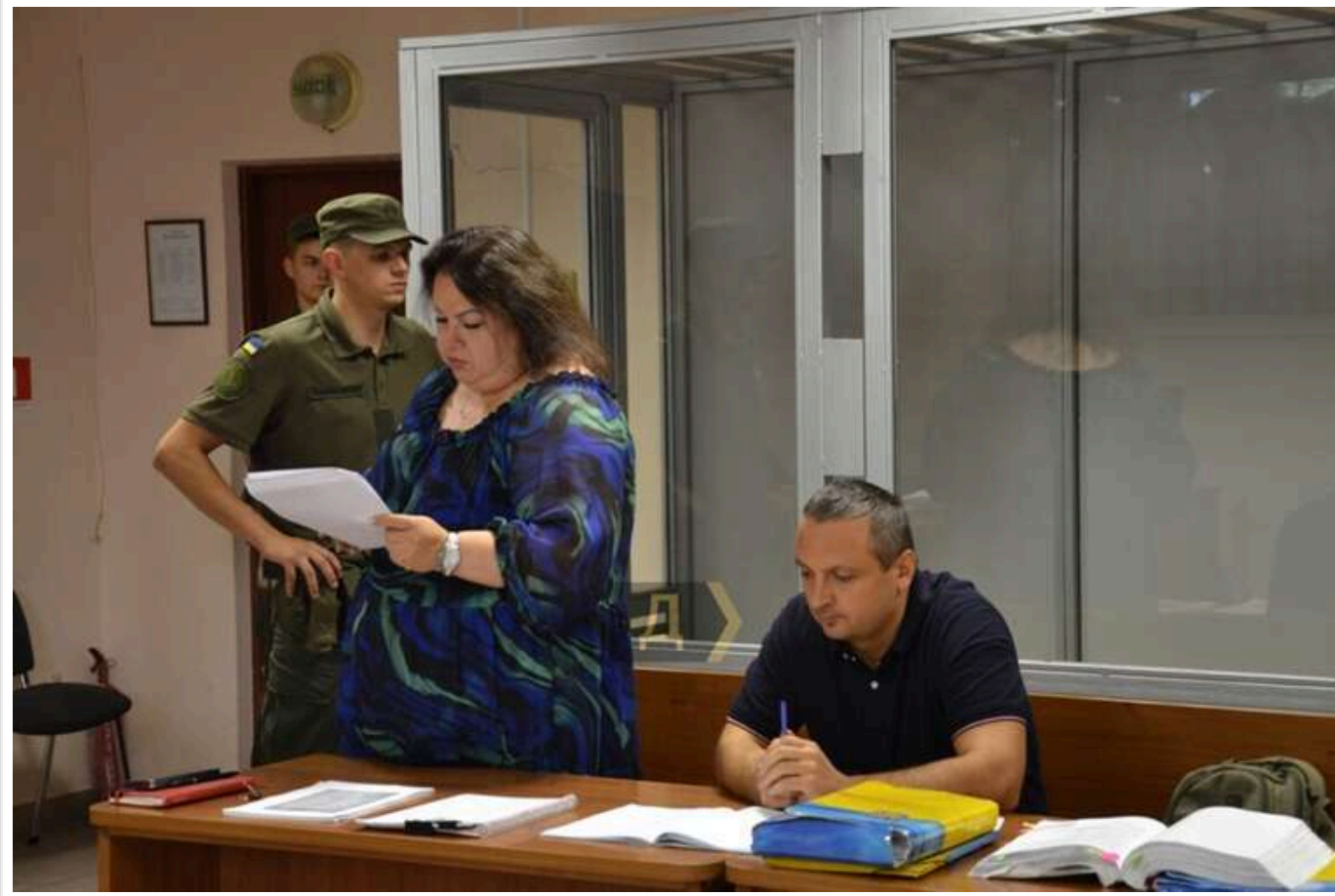
16,4 мільйона гривень збитків на закупівлі вуличних ліхтарів: САП скерувала до суду справу депутата Одеської облради