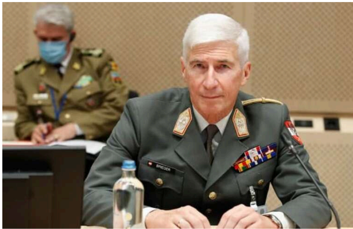
Мир в Україні могла б підтримувати місія ООН, яка включала б солдат із країн «глобального Півдня»

Про це журналу Die Welt повідомив голова Військового комітету ЄС Роберт Брігер.