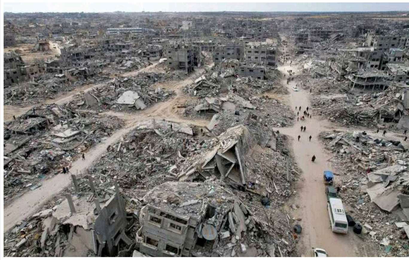
Трамп запропонував переселити жителів Гази в арабські країни

Президент США Дональд Трамп запропонував переселити палестинців з Гази до сусідніх арабських держав.