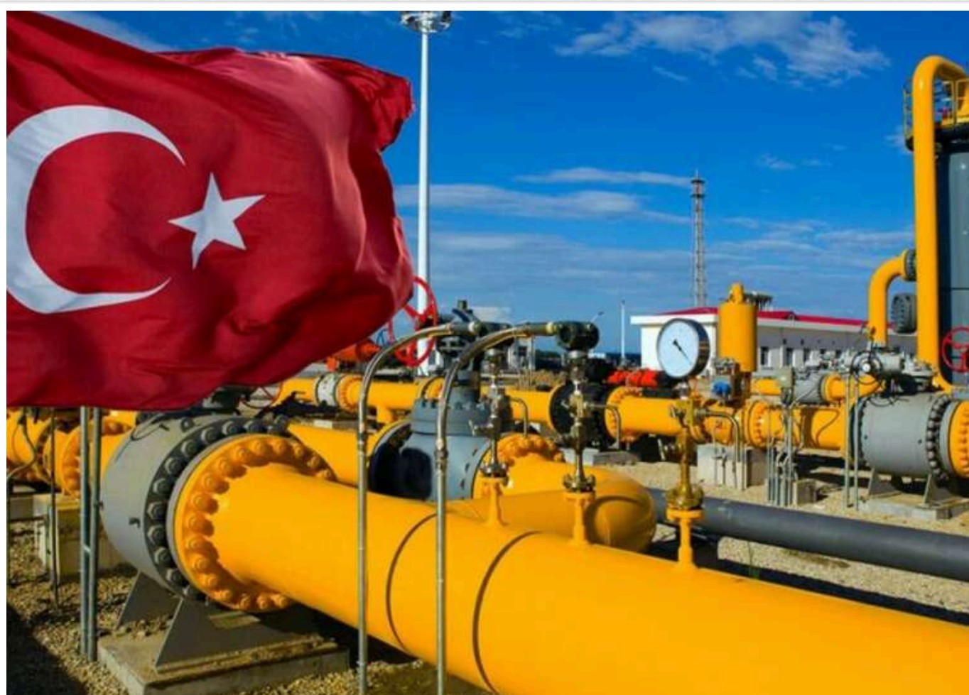
Politico: Туреччина планує підтримати ЄС у заміні транзиту газу через Україну

Туреччина намагається відновити енергетичні переговори з ЄС. Країна бачить себе великим постачальником природного газу після зриву попередніх переговорів через напруженість з Кіпром.