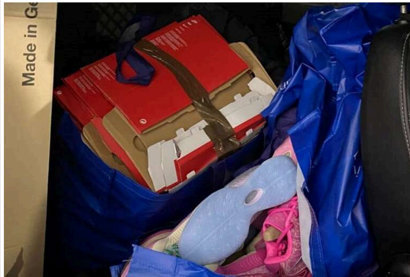
На Львівщині митники вилучили 89 пар кросівок "Nike" вартістю пів мільйона гривень

Вчора, 25 січня, митники Львівщини знайшли в салоні автомобіля "Mercedes" 89 пар кросівок "Nike" вартістю близько 500 тисяч гривень. На водія було складено протокол за недекларування товарів.