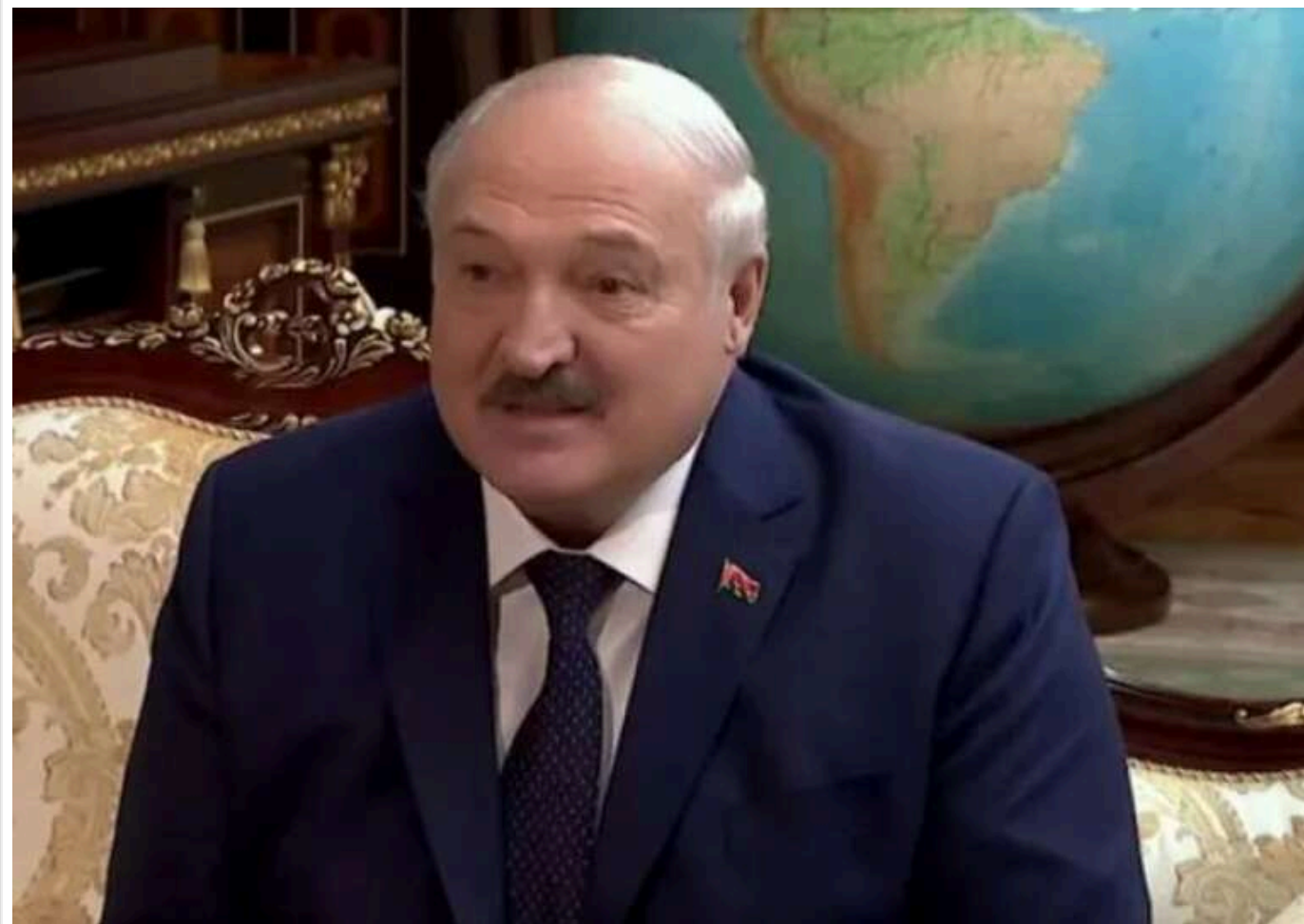
Лукашенко висловив розчарування з приводу передачі ядерної зброї Росії

З приводу "виборів" у Білорусі самопроголошений президент Білорусі Олександр Лукашенко зробив багато заяв, і в результаті наробив багато галасу.