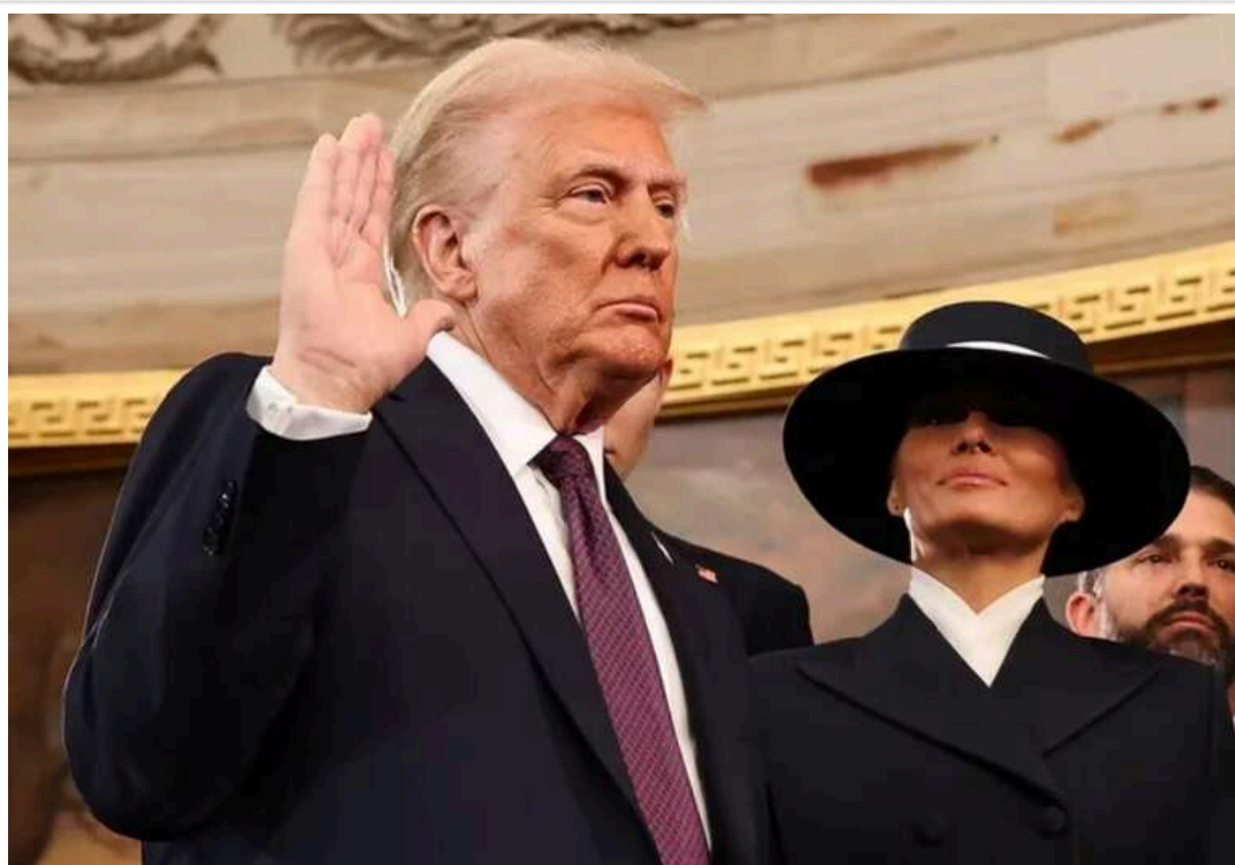
The Independent: Трамп планує завершити війну в Україні до весни

Побоювання з приводу того, що президент США Дональд Трамп може відмовитися від підтримки України, є "хибними". На користь цього нібито свідчить присутність на його інавгурації лідера фракції партії "Слуга народу" Давида Арахамії.