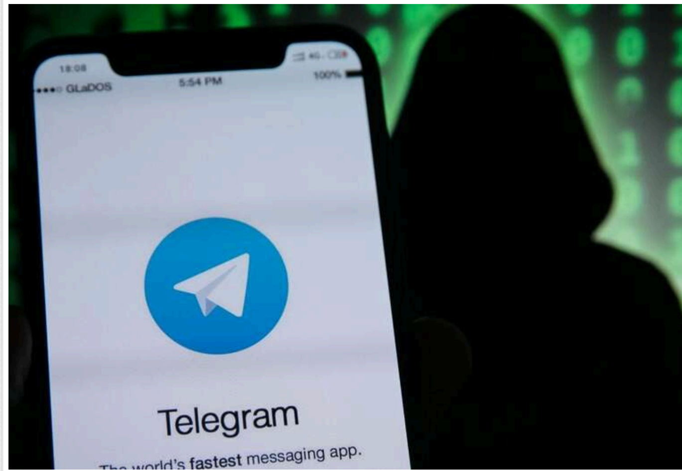
Telegram-шахрайства зросли на 2000%

Українці все частіше стають жертвами криптовалютних афер через Telegram, де шахраї використовують складні шкідливі програми для обману людей. Вони прикидаються відомими крипто-інфлюенсерами та створюють фальшиві групи для верифікації.