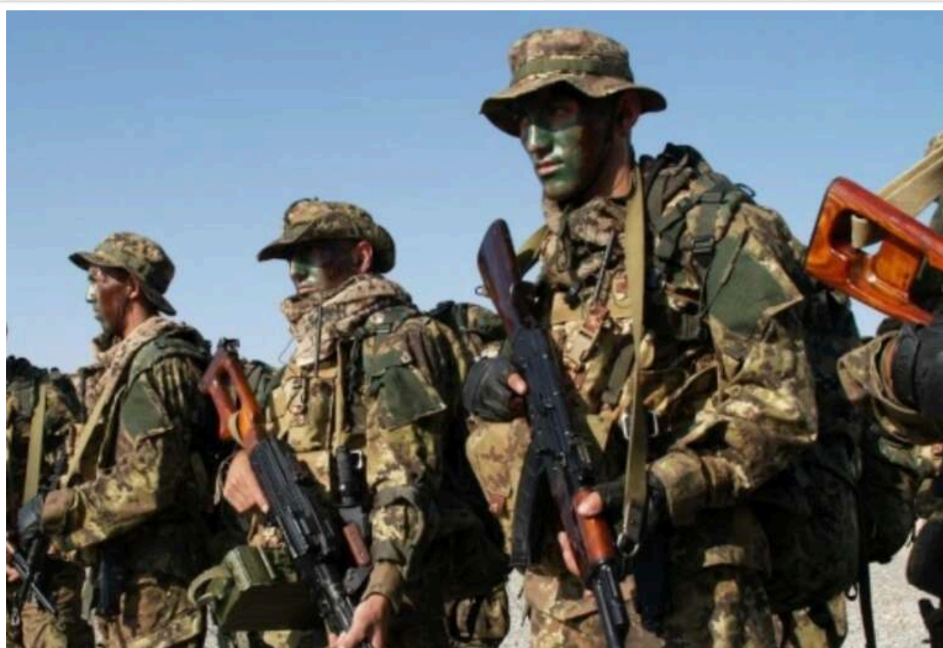
Біля Часового Яру з'явилися підрозділи "ахматівців" і "вагнерівців", - військові

У районі Часового Яру зафіксували підрозділи "Ахмат", колишніх "вагнерівців" і формування "Русіч". В цьому районі діють окупанти, які пройшли інтенсивну підготовку.