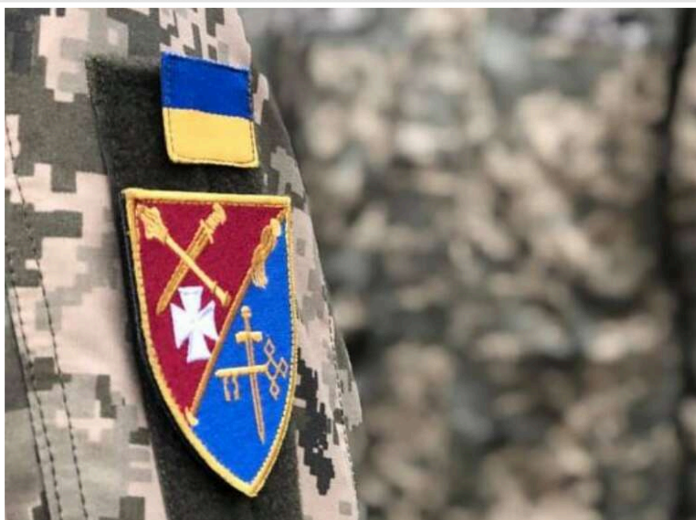
В Одесі ТЦК розпочав розслідування через ймовірне викрадення та побиття сина відомої письменниці

В Одесі співробітники ТЦК нібито викрали та побили сина відомої письменниці. У військкоматі розпочато службову перевірку.