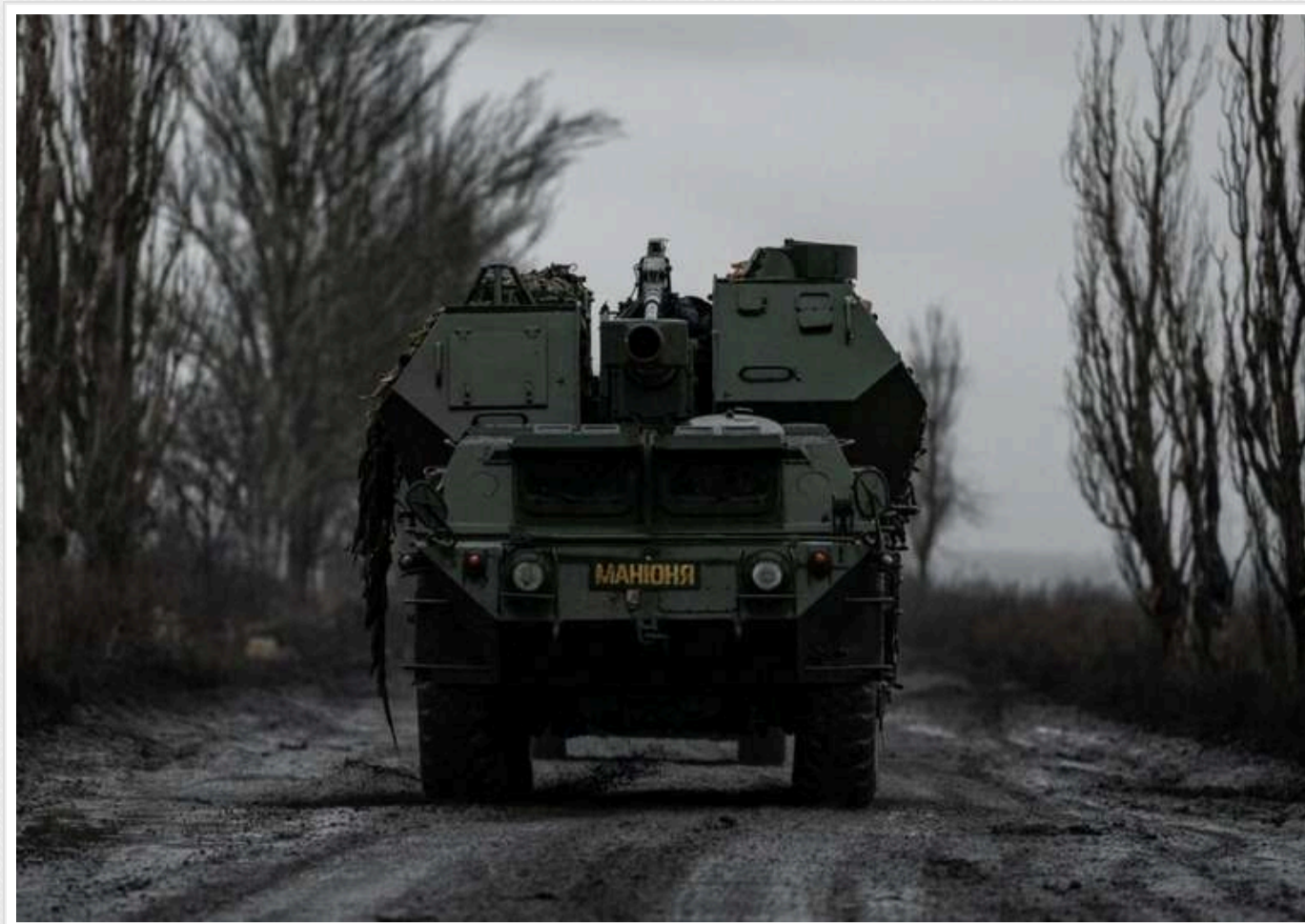
ЗСУ все ще знаходяться у Великій Новосілці, - 110-та ОМБр

Збройні сили РФ не зможуть продовжувати наступ з Великої Новосілки на Донбасі. Річка Мокрі Яли стала на заваді подальшим просуванням, повідомили українські бійці.