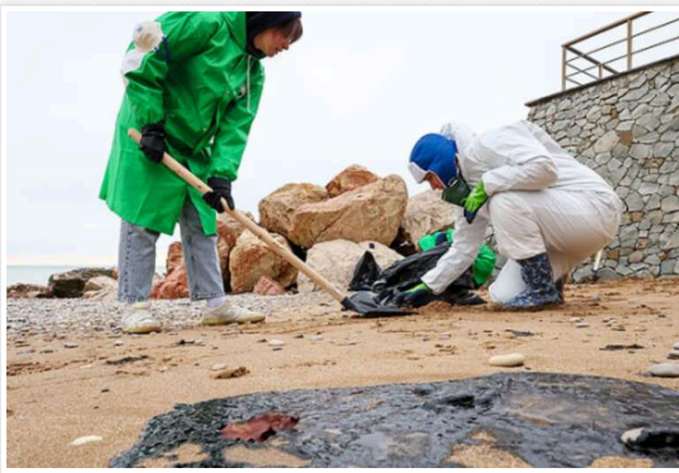
В окупованому Севастополі зібрали понад 590 тонн ґрунту, забрудненого мазутом

З початку ліквідації наслідків катастрофи російських танкерів у тимчасово окупованому Севастополі зібрано 592,534 тонни ґрунту, забрудненого мазутом.