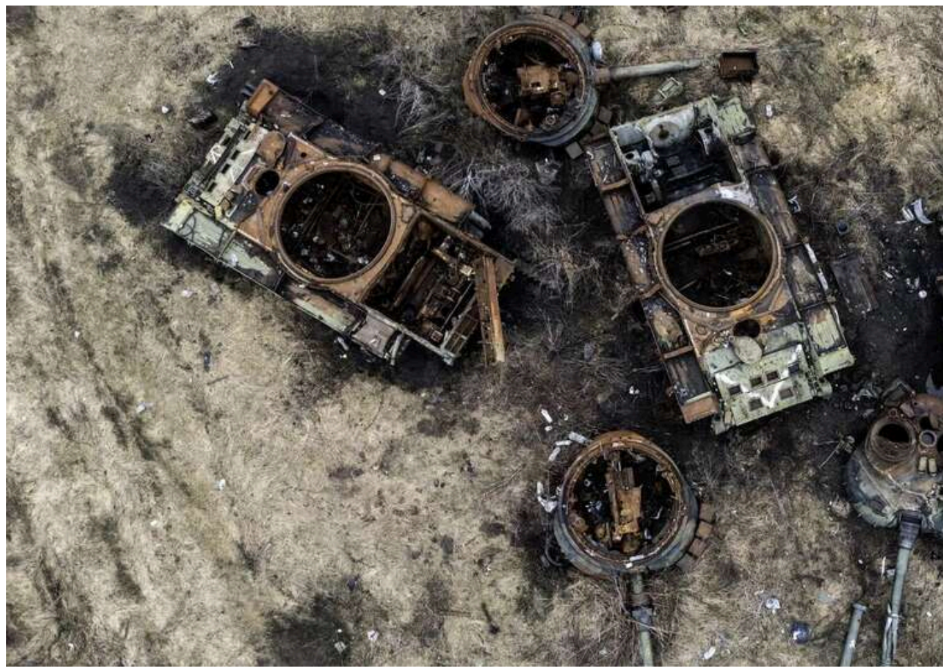
Втрати ворога за добу: ЗСУ відмінували 1720 окупантів і дев'ять танків

Протягом минулої доби Сили оборони України знищили 120 одиниць російської військової техніки та озброєння. Було також ліквідовано та поранено близько 1720 військових країни-агресорки.