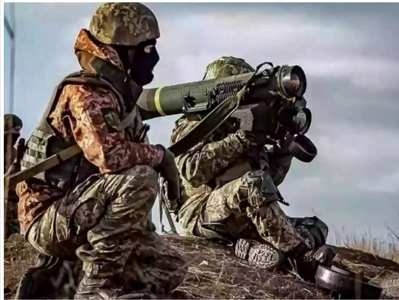
У The Times описали 4 можливих сценарії закінчення війни в Україні

ЗМІ відзначає, що Україна «перебуває в скрутному становищі», однак вона «ще не переможена». «На полі битви ситуація ще ніколи не була такою складною. У 2024 році російські сили захопили у шість разів більше української землі, ніж у 2023 році», - йдеться в статті.