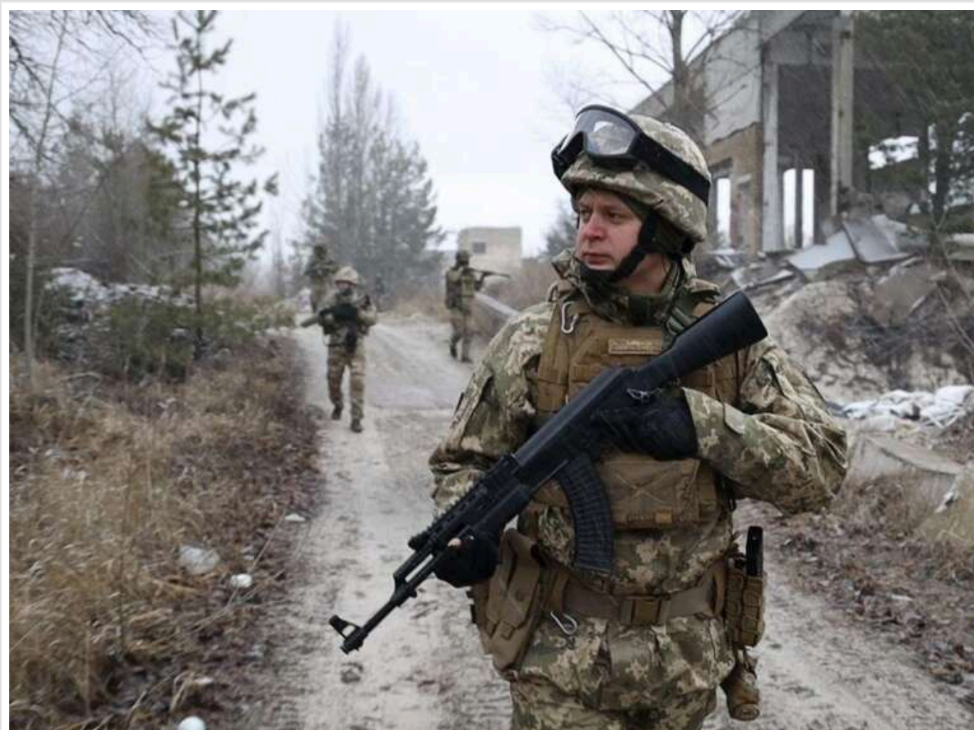
Ситуація на фронті: Від початку доби відбулося 159 боєзіткнень, на Покровському напрямку відбито 39 атак ворога, ще дев'ять – тривають

З початку доби 25 січня, станом на 22:00, на фронті сталося 159 бойових зіткнень.