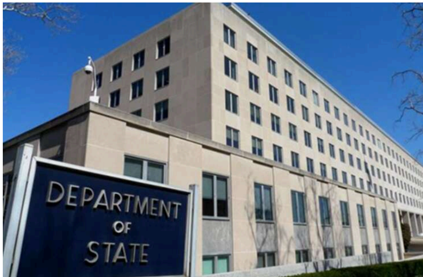
До Держдепу США звернулися з вимогою зняти 90-денну заморозку допомоги Україні

Американські дипломати звернулися до Держдепартаменту з проханням скасувати 90-денну призупинку допомоги Україні.