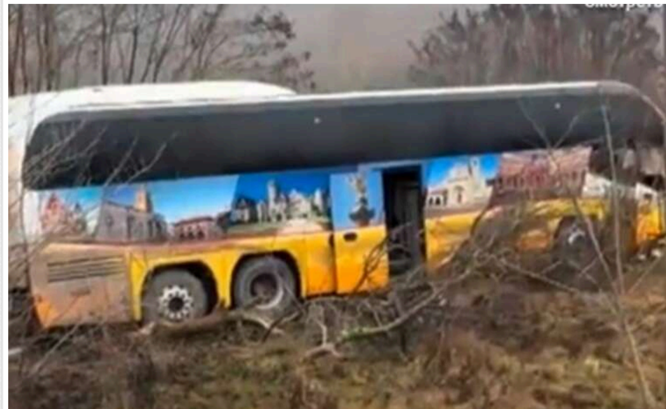
У Молдові потрапив у ДТП автобус "Київ – Кишинів"

У Молдові рейсовий автобус, що їхав з Києва до Кишинева, 25 січня потрапив у аварію на трасі біля села Пересечине Орґеївського району.