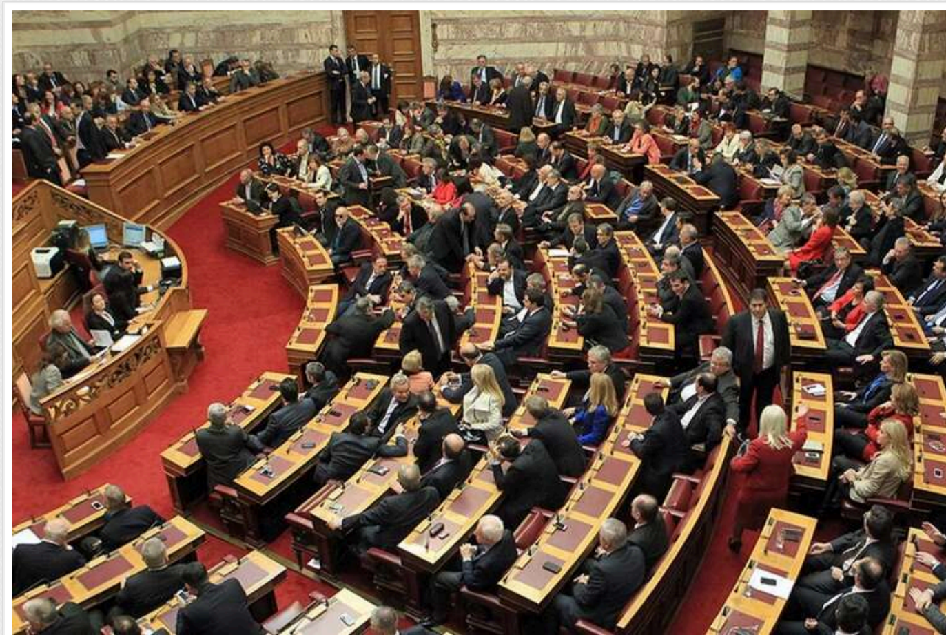
Парламент Греції не обрав президента в першому турі

Парламент Греції не зміг обрати нового президента в першому турі голосування, що відбувся у суботу, 25 січня.