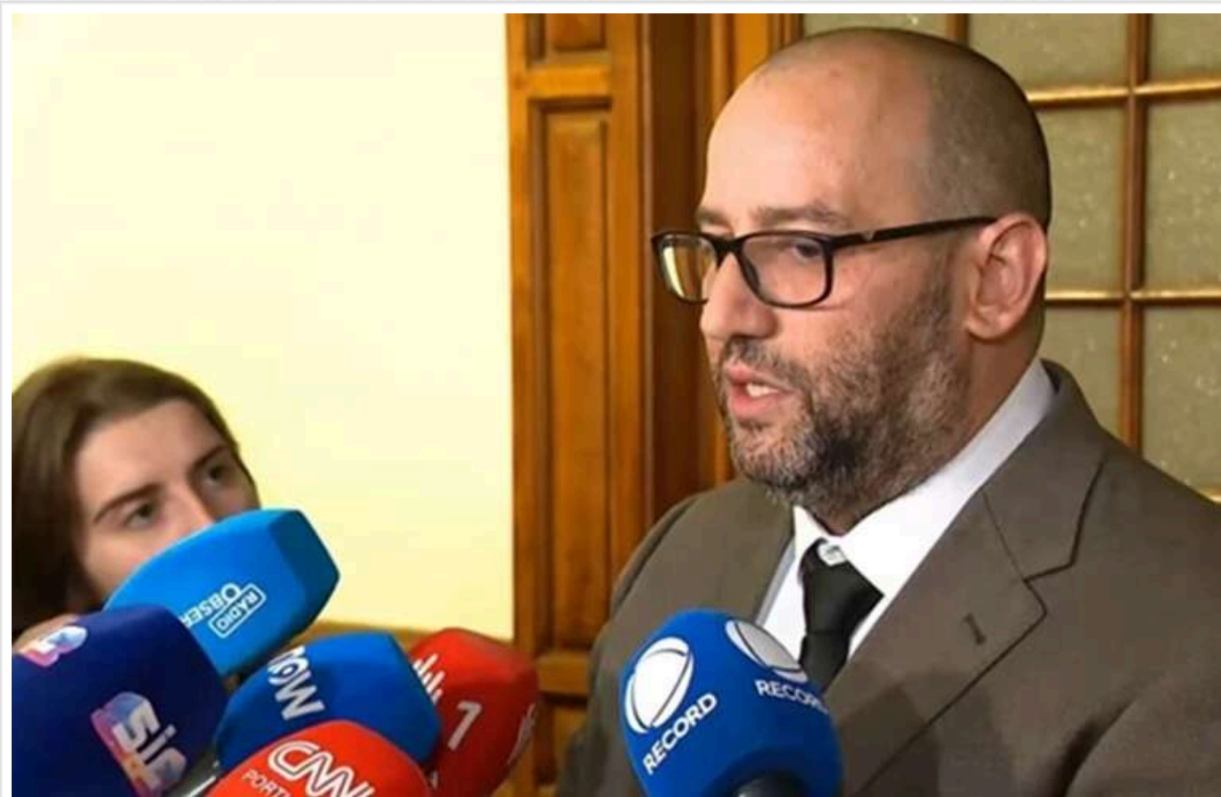
У Португалії політика звинуватили в крадіжці чемоданів в аеропорту

Депутата португальського парламенту підозрюють у серійних крадіжках валіз в аеропорту.