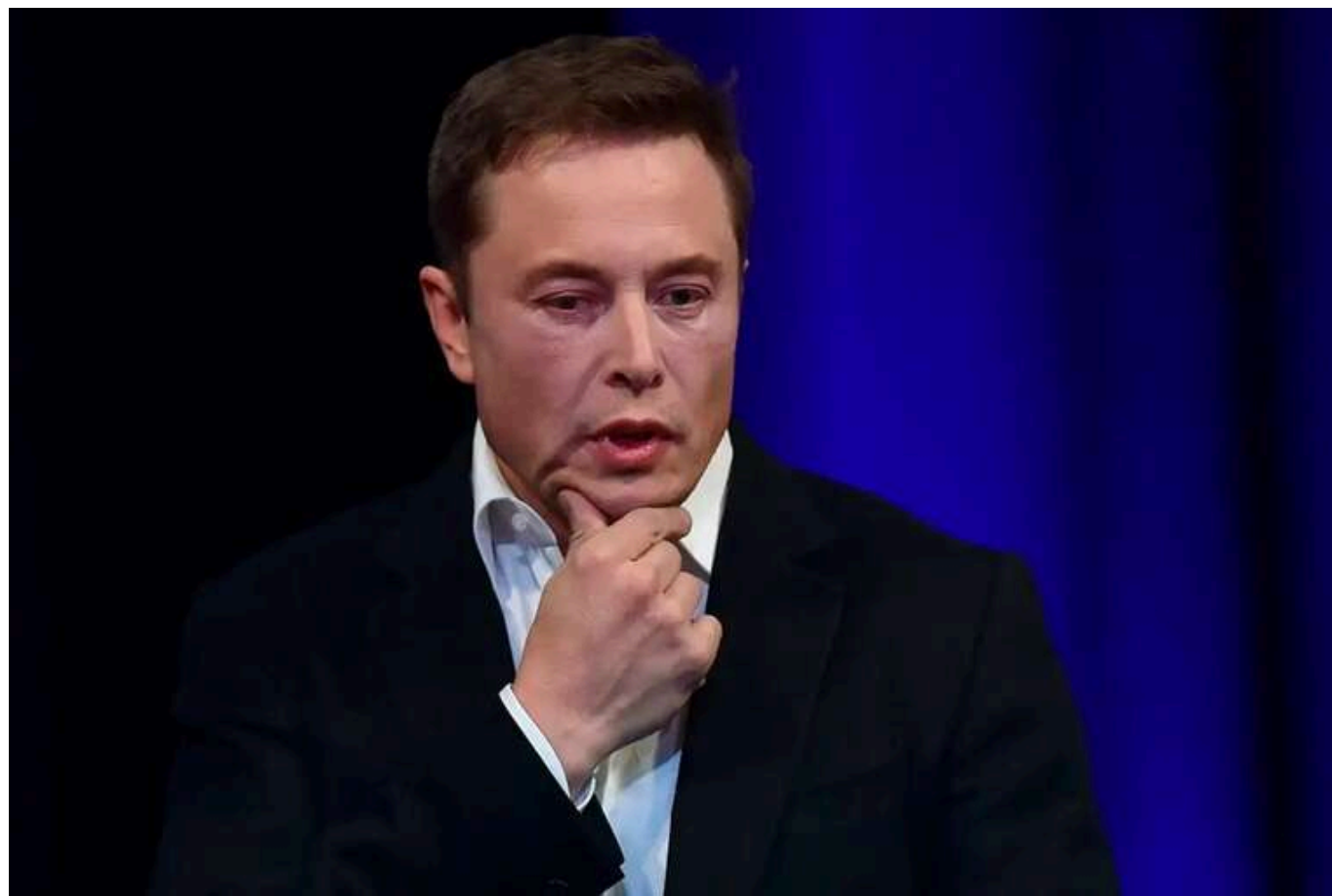
Ілон Маск хотів мати офіс в центрі Білого дому: йому не дозволили

Мільярдер Ілон Маск хотів отримати офіс у центральній частині Білого дому, але адміністрація президента США вирішила розмістити його Департамент з ефективності державного управління в будівлі виконавчого офісу Ейзенхауера.