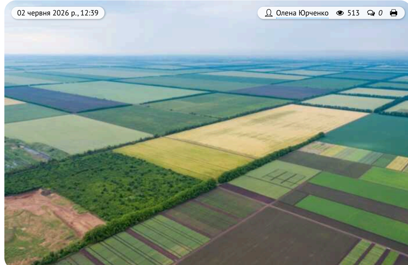
Земля є, житла немає: адміністраторка сервісного центру МВС на Волині Германюк «забула» вказати у декларації свій дах над головою

У декларації адміністраторки ТЦЦ МВС №0742 на Волині Вікторії Германюк зазначено три земельні ділянки, автомобіль Volkswagen Golf і готівку, однак відсутні дані про житло.