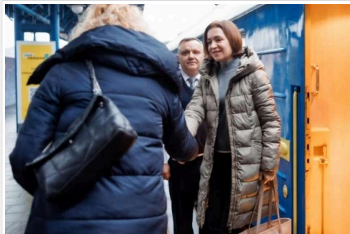
Президентка Молдови Санду приїхала з візитом до Києва

Президентка Молдови Мая Санду відвідала в суботу Київ із робочим візитом.