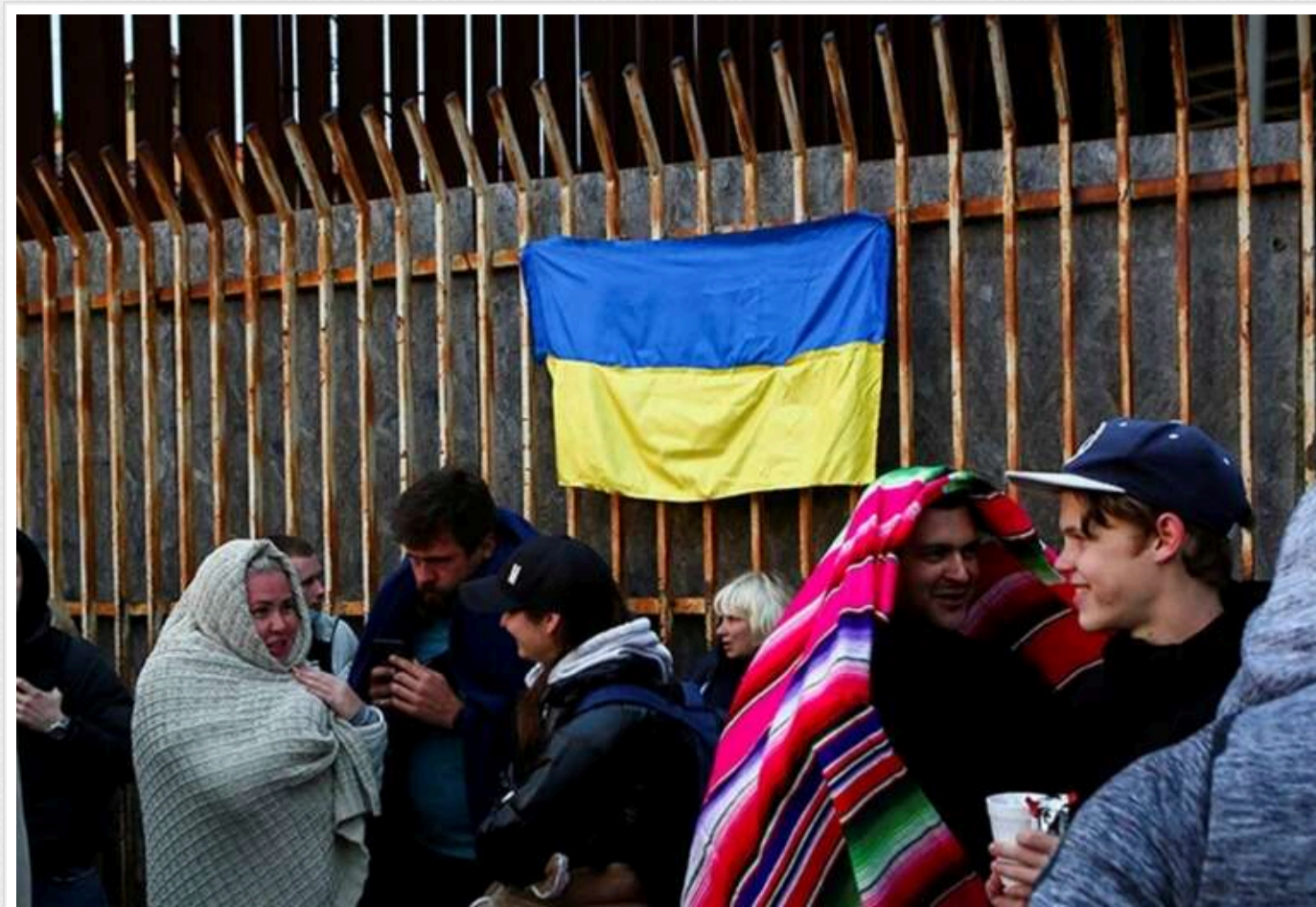
Українським біженцям заборонили в'їзд у США

Згідно з даними New York Times, Міністерство внутрішньої безпеки вирішило призупинити кілька програм, які давали можливість мігрантам тимчасово оселитися в Сполучених Штатах.