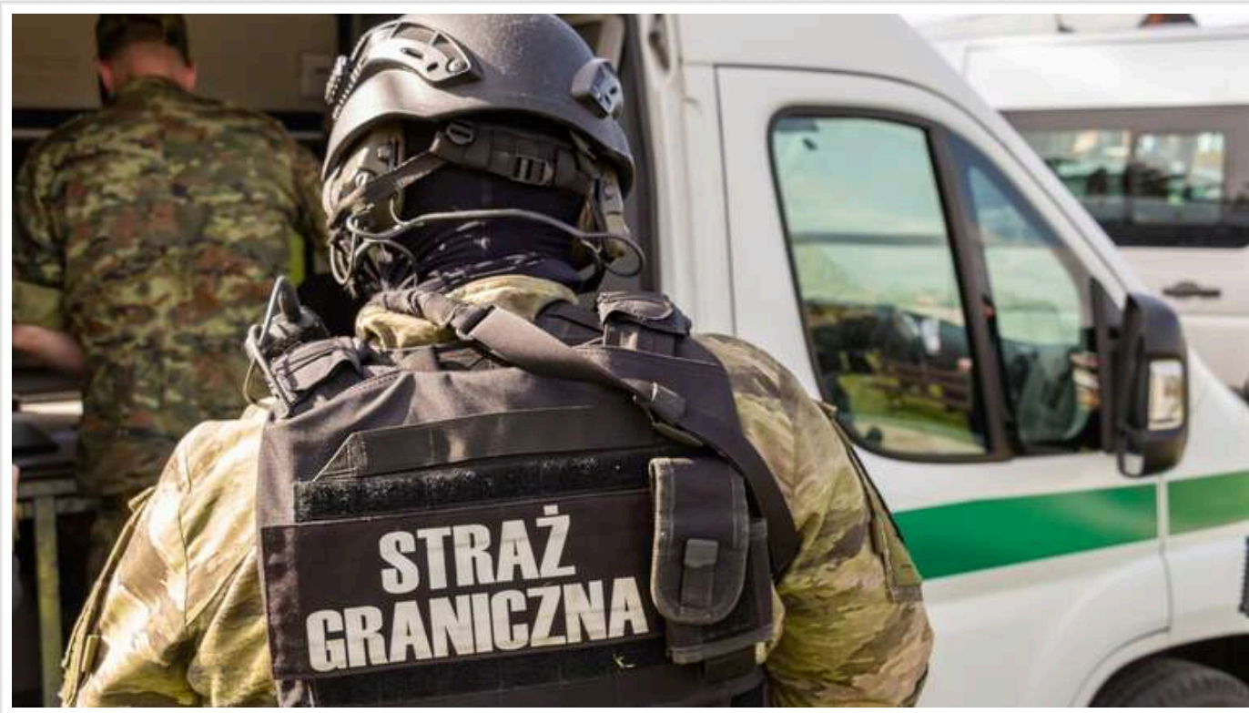
У Польщі депортували українця за систематичне водіння в нетверезому стані

У Варшаві співробітники Straży Granicznej затримали 24-річного громадянина України, який неодноразово порушував закон через водіння автомобіля в стані алкогольного сп'яніння. Чоловік, незважаючи на легальне перебування в Польщі, був депортований на батьківщину із забороною в'їзду до Шенгенської зони строком на шість років.