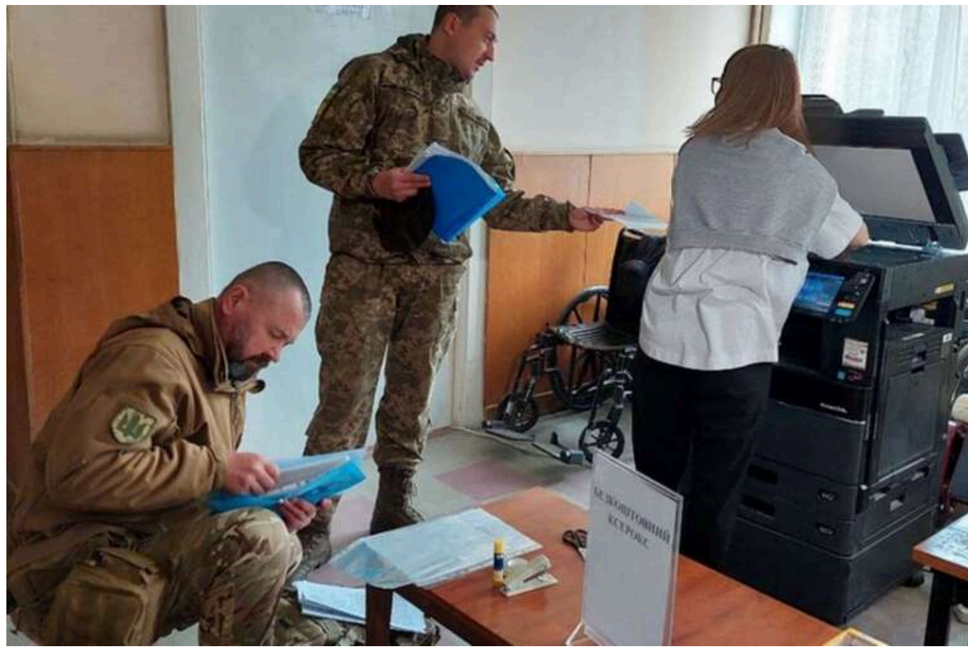
В ОП повідомили, що термін для повторного проходження ВЛК для "обмежено придатних" буде продовжено

В Україні, відповідно до закону, усі "обмежено придатні" військовозобов'язані мають знову пройти військово-лікарську комісію (ВЛК) до 4 лютого, але не всі можуть встигнути. Термін для повторного проходження буде продовжено.